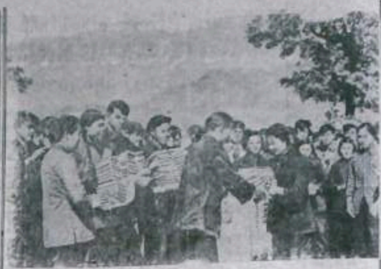
Городская молодежь Китайской Народной Республики организует сбор книг для мальчиков и девочек, живущих в деревне. Это движение призвано широкое распространение Собрания библиотеки, молодежь призывает представителей для вручения подарка систем сельским друзьям. На СНИМКЕ: молодежь работает и служащая Фуджуской бумажной фабрики (инициатива Фуджи) дарит книги сельской молодежи производственному коллективу.

Большим вкладом в дело укрепления дружбы между индийским и советским народами является посещение Советского Союза Премьер-Министром Индии Джавахарлалом Неру. Советский народ выражает твердую уверенность в том, что этот дружественный визит главы правительства Республики Индии послужит дальнейшему укреплению советско-индийских отношений, явится важным вкладом в совместную борьбу наших народов за мир и экономическое процветание.