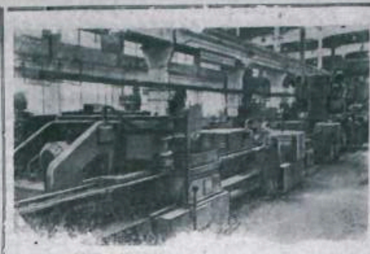
Московский станкостроительный завод имени Серго Орджоникидзе — передовое предприятие станкостроительной промышленности. С начала года станкостроители выпустили более ста агрегатов станков новой конструкции. На днях коллектив сборщиков раньше срока закончил сборку и испытание новой автоматической линии, предназначенной для фрезерной обработки головок блока цилиндров трактора ДТ-54.

Вступая в социалистическое соревнование в честь Дня шахтера, коллектив фабрики принял на себя новое повышенное обязательство. Мы приложили все силы и тонус, чтобы вести неустанно целеустремленную борьбу на дальнейшее увеличение выпуска брикета.