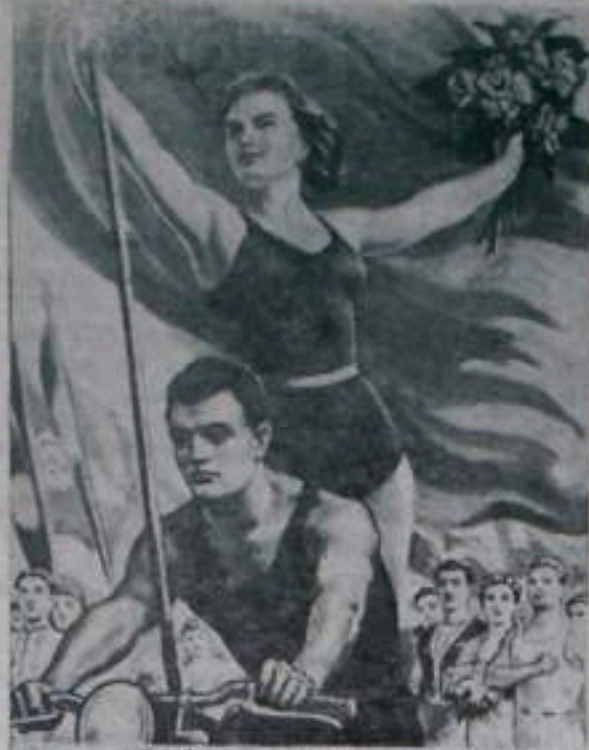
Спорт в СССР - спорт миллионов!