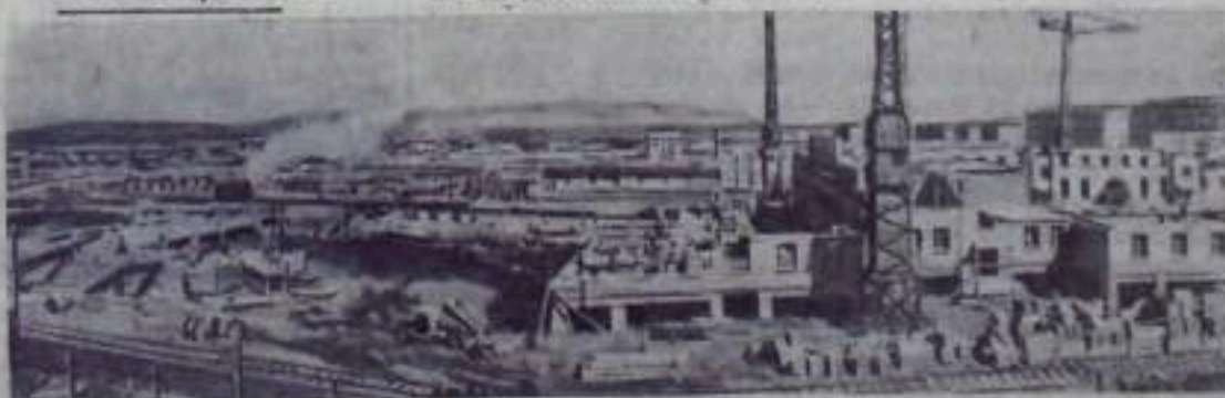
НА СНИМКЕ: строительство квартала жилых домов на окраине Норильска. Эта стройка ведется новоселами-москвичами.