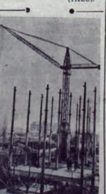
В Народной Республике Болгарии осуществляется метод пильно-блочного строительства. На улице имени Цветко Радонова в Софии строится первое здание из готовых пилей. На снимке: общий вид строительства.

ЭНЕРГОВЕЗД ДЛЯ СОВЕТСКОГО СОЮЗА На Чехословацком заводе «Татра» (в Колине) построен второй энерговезд для Советского Союза. По сравнению с первым поездом, который построен для Советского Союза в 1953 году, новый имеет много преимуществ. Его мощность 2500 киловатт. Энергопоезд может снабжать электроэнергией город с 10 тысячами жителей и его промышленные предприятия. (ТАСС).