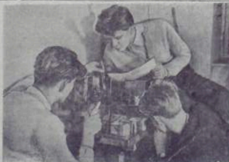
В Германской Демократической Республике идет активная подготовка к VI Всемирному фестивалю молодежи и студентов. Кружки, работающие при Центральном клубе молодежи в Берлине, занимаются изготовлением подарков для участников Московского фестиваля.