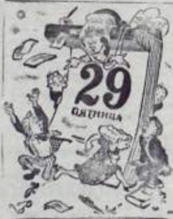
...в конце месяца