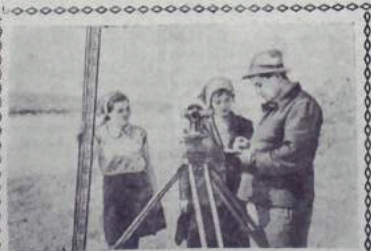
КАЗАХСКАЯ ССР. На Иртыше, в 70 километрах выше Семипалатинска, находится комплексная экспедиция, ведущая изыскательские работы на месте предстоящего строительства Шульдинской ГЭС. В составе экспедиции — большой отряд топографов.