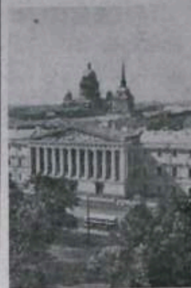
Ленинград. Вид на восточный фасад Адмиралтейства.

На стендах хозяйства Зауралья (Знаменский совхоз, колхозы «Красный доброволец», «Победа», имени Калинина и др.) показывается наиболее подробно методы работы, благодаря которым хозяйства добились высоких показателей в растениеводстве, использовании средств производства, снижении себестоимости