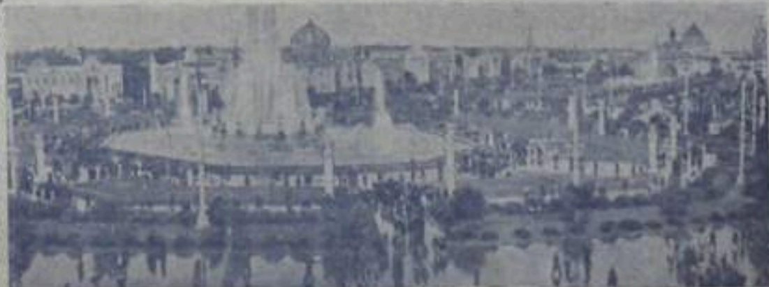
Москва. Всесоюзные сельскохозяйственная и промышленная выставки 1957 года. НА СНИМКЕ: общий вид выставок.

Кровь и потуемной плахи залила Холмы Москвы и землю Салавата. Одни окопы и одна гарма — Таков удел обоих был батыров. Одни огонь испепелил дома И русских братьев, и дома башкиров. На разных говорах языках, Но в правде путь у нас один, мы знали, И на свободу общую в боях Мы вместе на своих конях связали. Под красным флагом русский и башкир Тромили старый, ветхий, ливный мир. И в море сбросили солдат незванных Четырнадцать армий иностранных. Под этим знаменем, как и вчера, Мы с русскими в одном строю шагаем. Пришла, пришла цветная пора — Мы идяне коммунистами воздаем!