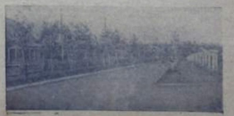
НА СНИМКЕ: уголок угля Парковой