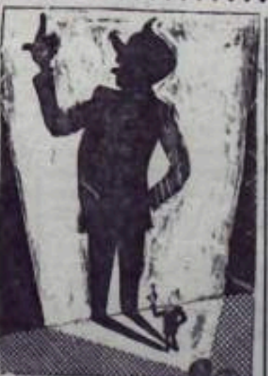
Здесь дано сравнение Оригинала с самоменьем.

Народная мудрость гласит: «Горлом таба не рубится!» Кивая Розенцвейг кричит на подчиненных, как говорится, очень горло.