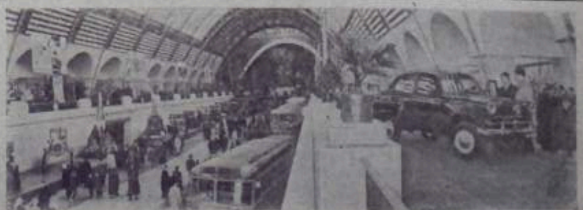
Москва. Весовые сельскохозяйственные и промышленная выставки 1957 года.

НА СНИМКЕ: в павильоне «Машиностроение».