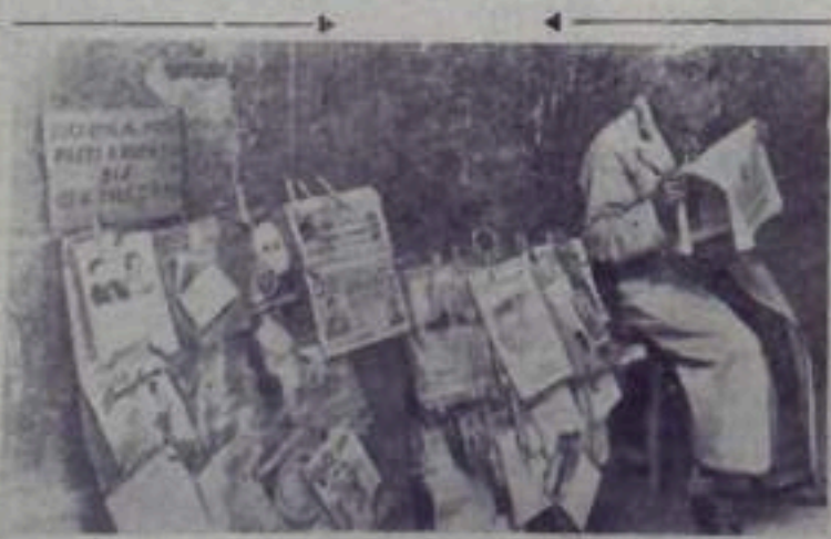
Италия. Продавец газет на улице Неаполи.