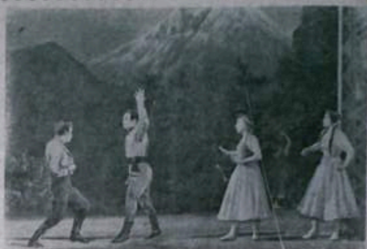
МОСКВА. В Большом театре Союза ССР состоялась премьера балета А. Хачатуряна «Гализе».

Как сообщает болгарское телеграфное агентство, за годы народной власти на судостроительной верфи в Варне построены суда общим водоизмещением 178.885 тонн. Это в 10 раз превышает тоннаж судов, построенных на верфи за прежние почти 40 лет ее существования. (ТАСС).