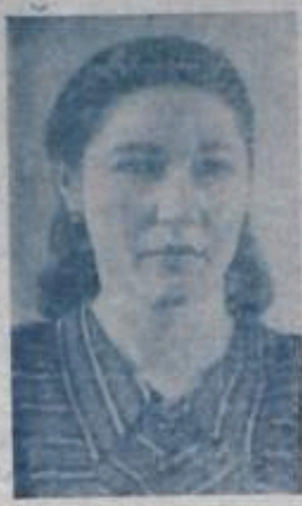
на других электростанциях.

Большинство электростанций системы «Башкирэнерго» используют в качестве топлива казак. Потребление электроэнергии с Ермаковской ТЭЦ значительно снижает расходы ценного топлива