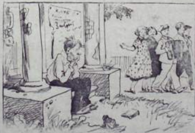
— Товарищ заислужом, пойдем с нами, повеселимся!