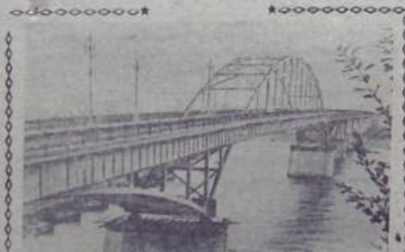
БАШКИРСКАЯ АССР. В Уфе построим большой железобетонный мост через реку Белую. Новый мост свяжет левобережные районы республики с городом Уфой.

Хотя как-то не принято начинать дружеские беседы по об-