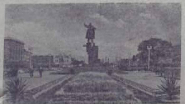
Ленинград. Площадь Ленина у Финляндского вокзала. В центре — памятник В. И. Ленину.

В эти дни на предприятиях города Ленина широко развернулось соревнование за достойную встречу всенародного праздника — сороковой годовщины Великого Октября. Славный юбилей советской власти трудящиеся города встречают новыми производственными достижениями — досрочным освоением и выпуском новейшей техники.