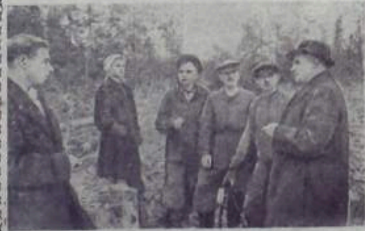
МАРИЙСКАЯ АССР. Совнархоз республики приступил к работе. Состоялось первое заседание, на котором совет обсудил организационные вопросы.

Встречая как дорогих гостей участников VI Всемирного фестиваля, наша молодежь, все советские люди радушно говорят им: «Добро пожаловать в Москву на праздник юности, мира и дружбы!»