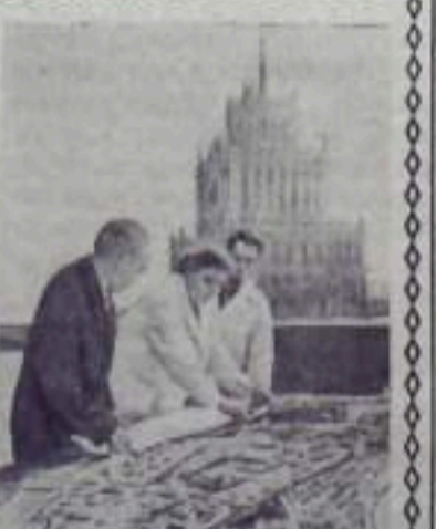
отдельных районов юго-запада и центр столицы и другие районы города.

Редкое переоборудование новой трассы с другими магистралями Москвы позволит транспорту развивать на ней большую скорость, что значительно сократит время сандования на