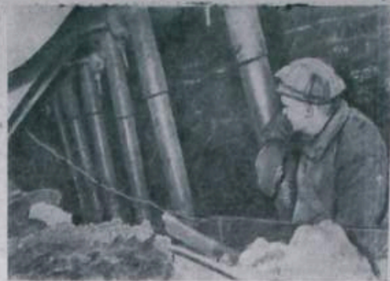
ТУЛЬСКАЯ ОБЛАСТЬ. Коллектив лантесовского завода «Углемаш» сконструировал и изготовил самый крупный и мощный в стране механизированный крепильный щит «Мосбасс». Длина его — 25 метров. Передвигается он с помощью гидравлических приспособлений. На основании щита смонтирован мощный конвейер.

Участники совещания договорились о том, чтобы в самое ближайшее время широко развить эту новую ценную инициативу и ускорить сооружение жилья для трудящихся не только за счет государственных капиталовложений, но и за счет инициативы самих трудящихся.