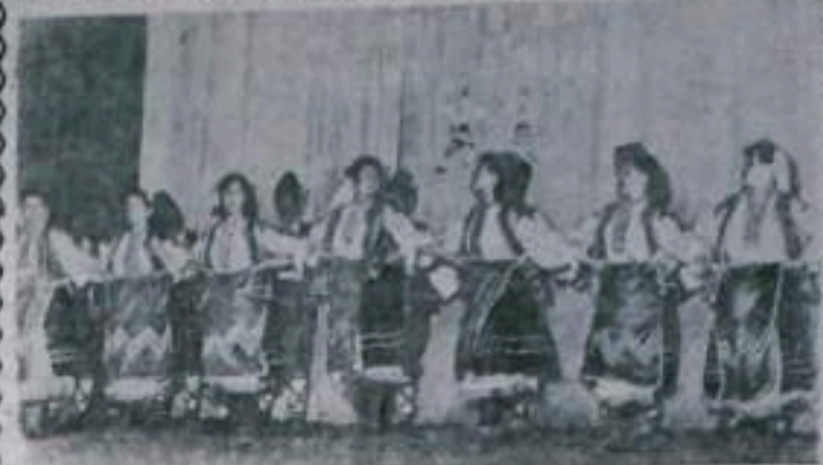
В Народной Республике Болгарии проходит подготовка к VI Всемирному фестивалю молодежи и студентов в Москве. В Софии состоялся республиканский фестиваль студенческой молодежи.

На СНИМКЕ: танцевальная группа Института механизации и электрификации сельского хозяйства (город Руса) и спонсирует болгарский народный танец.