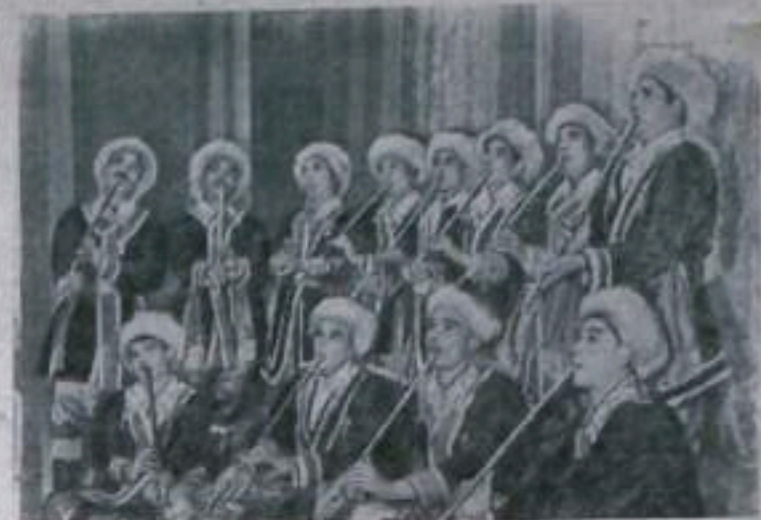
Башкирская АССР. Большой популярностью пользуется ансамбль кураистов Баймакского района. Сейчас этот коллектив готовится к фестивалю. НА СНИМКЕ: ансамбль кураистов.