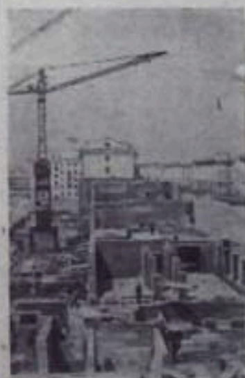
С каждым днем хорошеет город юности — Комсомольск-на-Амуре.

НА СНИМКЕ: строительство жилого дома на 118 квартир на проспекте Сталина.