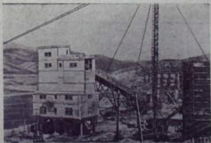
Казахская ССР. На строительстве Бухтарминской ГЭС. НА СНИМКЕ: бетонный завод.

Итоги социалистического соревнования подводятся Министерством коммунального хозяйства совместно с обкомом профсоюза рабочих коммунального хозяйства и представляются на рассмотрение в Совет Министров и обком КПСС не позднее 15 числа последующего месяца.