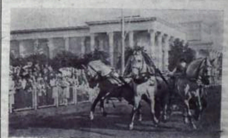
Москва. Всесоюзная сельскохозяйственная выставка 1956 года.

В воскресенье, 24, игры на стадионе состоялась игра двух сборных городских футбольных команд, которые будут принимать участие в соревнованиях на первенство Башкирии. Игра закончилась со счетом 3:2 в пользу основной команды общества «Шахтер».