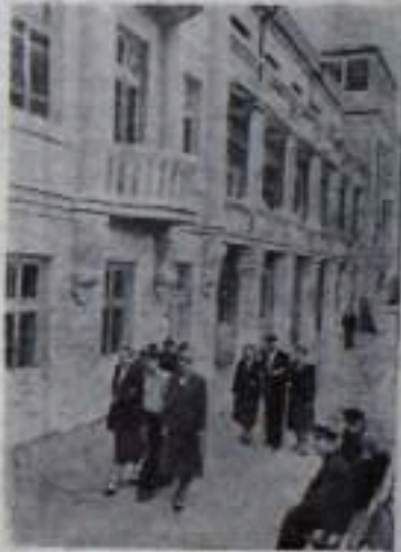
КАМЕНСКАЯ ОБЛАСТЬ. На берегу Дона в живописном месте расположен Мелокровский Дом отдыха. Здесь проводят отпуск горняки шахт комбината «Ростов-уголь».

Последние минуты прощания. Поезд медленно трогается с места. В добрый путь, дорогие товарищи!