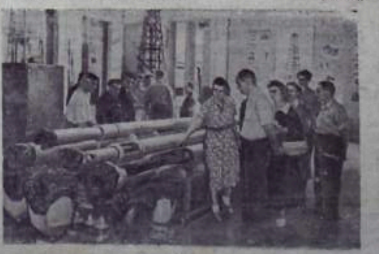
На правом снимке: посетители осматривают высокопроизводительные заводные двигатели для турбинного бурения — турбобуры, успешно применяемые на всех нефтепромыслах Советского Союза и экспортируемые в другие страны.