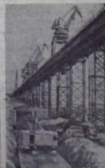
Сталинградгидрострой. Подготовка площадки для монтажа арматуры.