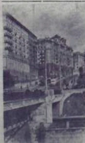
Москва, улица Чкалова.

...Стих рокот моторов машин. На несколько минут опустела дворцовая площадь. И вот ее заливают море знамен. На площадь вступает трудовая Ленинград.