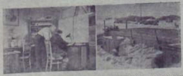
Антарктида. Справа — дома зимовщиков в поселке Мирный. Слева — в синоптическом бюро южнополярной обсерватории Мирный.