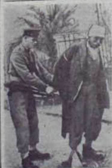
К ПОЛОЖЕНИЮ НА КИП РЕ. На улице в Илгозья. Аглицкий солдат объясняет старого крестьянина.