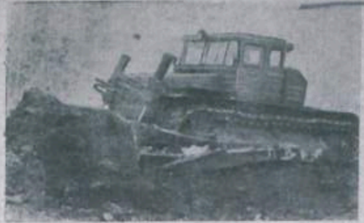
Челябисский тракторный завод изготовил новый трактор мощностью 250 лошадиных сил с электрической трансмиссией. На тракторе установлен бульдозер с ножом длиной 6 метров. Электрическая трансмиссия обеспечивает плавное автоматическое изменение скорости в зависимости от сопротивления движению, облегчает труд тракториста и повышает производительность машины. Трактор имеет удобную с круговым обзором кабину, обогреваемую зимой и вентиляруемую летом. Новый трактор найдет широкое применение при строительстве дорог и различных сооружений. НА СНИМКЕ: новый 250-сильный трактор с бульдозером.

В разрезах на вскрышных участках продолжает иметь место аварийность механизмов из-за нарушения сроков планово-предупредительного ремонта и низкого качества выпускаемой продук-