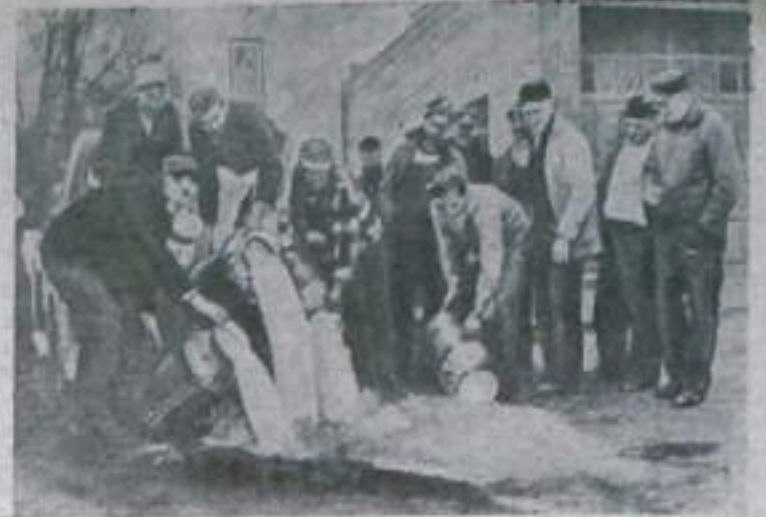
Фермеры Соединенных Штатов Америки продолжают борьбу за улучшение своего положения. Они выдвигают требования о повышении закупочных цен. Сейчас за молоко потребитель платит 25 центов; фермер получает из них только 8 центов. Остальное забирают монополисты. В трех штатах фермеры бойкотируют торгующие компании. На дорогах установлены пикеты, не допускающие шрейберхеров.

НА СНИМКЕ: фермерский пикет в Калифорнии (штат Нью-Джерси) выливает на землю молоко, которое владелец направил на маслобойню.