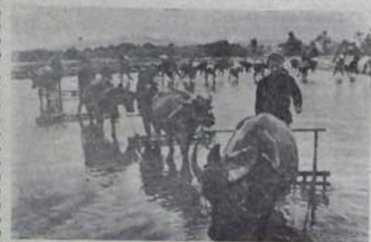
На первом снимке.

ПОЛЬСКАЯ НАРОДНАЯ РЕСПУБЛИКА. Сельскохозяйственное машиностроение является одной из новейших отраслей польской промышленности, возникшей в послевоенные годы. В стране построены ряд новых предприятий. Вблизи Варшавы сооружен первый польский тракторостроительный завод «Урсус», который за годы своего существования дал народному хозяйству свыше 30 тысяч тракторов.