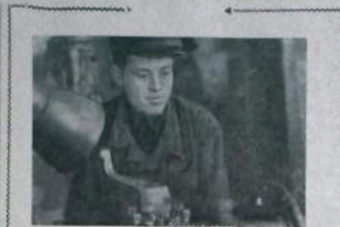
Каждый рабочий день занимается обслуживанием своей горной машины бригады добычи угля. Горняки Советского Союза вносят огромный вклад в развитие народного хозяйства. Их труд — основа процветания нашей страны.

Каждый рабочий день занимается обслуживанием своей горной машины бригады добычи угля. Горняки Советского Союза вносят огромный вклад в развитие народного хозяйства. Их труд — основа процветания нашей страны. Каждый рабочий должен любить и беречь свою горную машину, как свое второе «я».