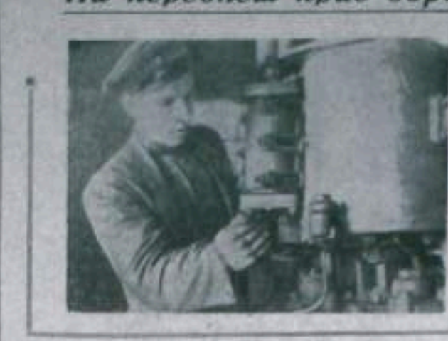
На переднем крае борьбы за уголь

Третий советский искусственный спутник Земли—новый этап в проведении широких научных исследований в верхних слоях атмосферы и в изучении космического пространства—большой вклад советских ученых в мировую науку.