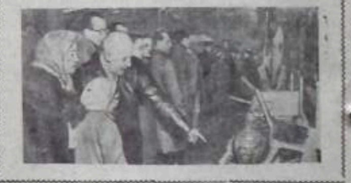
На производственной выставке в Ленинграде... (Caption for the photograph)

Письмо из Ленинграда... (Text about letters and public opinion)