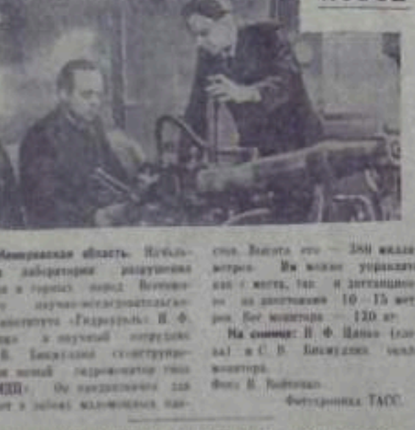
Минеральная область. Работники лаборатории разрабатывают уголь в горелках буровых установок.

Открыты сессии в 2 часа дня в зале заседаний городского КПСС