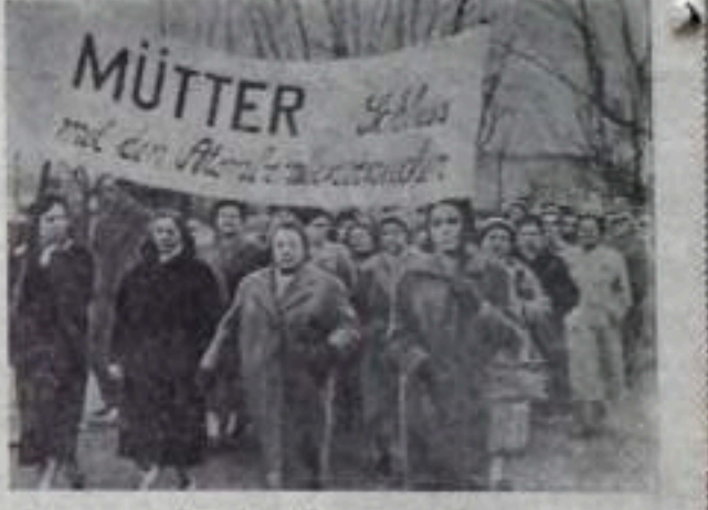
Федеративная Республика Германия. В Дортмунде состоялась митинг протеста против атомного вооружения...