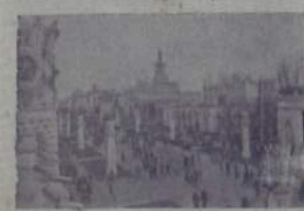
Москва. Промышленная выставка 1958 года. На выставке на территории выставки.

Совещание обсудило вопросы дальнейшего развития экономического сотрудничества между социалистическими странами на основе последовательного осуществления международного социалистического разделения труда, специализации и кооперации производства, а также обменялся информацией о работе Государственных плановых органов социалистических стран по развитию перспективных отраслей народного хозяйства.