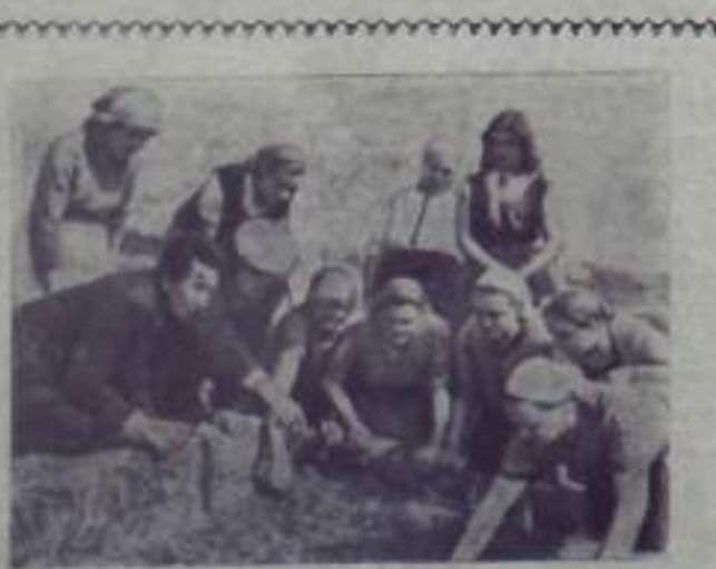
В Варшаве Государство Болгария выдало гостеприимство своим гражданам. Они получили в Варшаве гостеприимство от друзей своих соотечественников.

Военные действия в Алжире. В последние дни в Алжире ведутся ожесточенные бои. Французские войска пытаются вернуть контроль над территорией. В результате боёв погибли многие люди. Военные действия в Алжире.