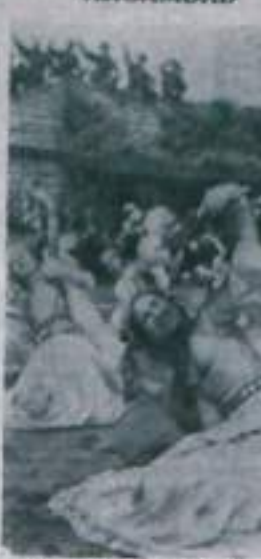
Азербайджанская ССР. Самодеятельный ансамбль песни и танца бакинского завода имени лейтенанта Шмидта.

— А вы кто? — спросил Николай. — А вы кто? — спросил Николай. — А вы кто? — спросил Николай.