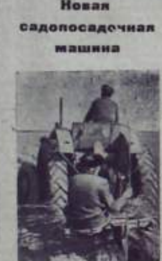
Новая садопосадочная машина

Партийная организация КСУ умело использует такое действенное средство, как наглядная агитация. На каждом строительном объекте, и бригадах в районах — можно видеть горячие призывы партии к успешному выполнению задач пятилетия. В докладах, отчетах, беседах агитаторов ведется широкая пропаганда материала и методов XXI съезда партии в тесной связи с конкретными задачами строителей. Она акцентирует внимание на новые трудовые подвиги, мобилирует его на совместный труд на всех объектах коммунистической нашей стране. Работа с людьми, — считает их инициативы, — вот что является залогом успеха партийной организации в борьбе за успешное выполнение производственных планов четырех месяцев первого года семилетки.