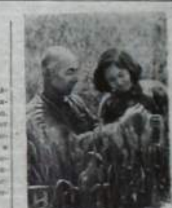
Китайская Нарманская Республика. В провинции Сунчунь успешно проводится работа по развитию культуры.

Между Нарманской Республикой Албанией и Советским Союзом укрепилась дружеская связь. Это способствует развитию сотрудничества и взаимопомощи.