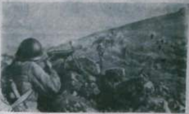
Бойцы Н-ского подразделения в наступлении на одном из фронтов Отечественной войны.