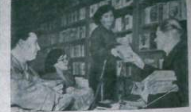
Ленинград. Хорошо организованное распространение книг на заводе «Светлана». В прошлом году заводским комсомольским отделом продано книг на сумму 100 тысяч копеек.

Отношение ребенка к матери — важнейшая тема, которая волнует родителей. В воспитании ребенка мать играет главную роль. Она должна любить, уважать и воспитывать своего ребенка. Мать должна любить, уважать и воспитывать своего ребенка.