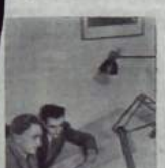
Гейбуши ширмама с товарищами.

Между Нарманской Республикой Албанией и Советским Союзом укрепилась дружеская связь. Это способствует развитию сотрудничества и взаимопомощи.