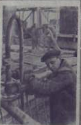
Волжская область. Западнее Свердловска строится завод по производству высококачественного стекла № 9 «Горнолышского» Литейно-Химического управления БССР.