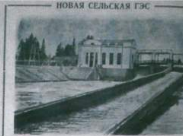
Витебская область. В Гусевском районе ведутся в строй первый агрегат Калужской области гидроэлектростанции на реке Неман. С правой стороны турбины мощностью электростанции достигают 520 киловатт. Ее монтаж будет осуществляться в 20 километрах отсюда.

Цеховой комитет не имеет в своем распоряжении никаких средств. Цеховой комитет не имеет в своем распоряжении никаких средств.