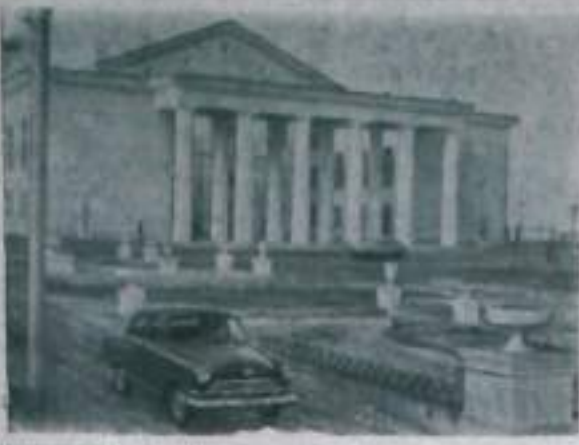
Красноярский край. Недавно построенный Дом культуры в молодом поселке шахтеров Бороздино.

Одной из главных причин плохой работы агитпункта является то, что с ними не ведется активной работы.