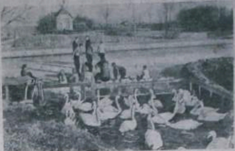
Голландия. На канале близ местечка Хоогмаде в окрестностях Лейдена.

По горизонтали: 6. «Марина». 7. Арман. 8. Лапса. 9. «Сирена». 10. «Клятва». 11. Федин. 12. «Искры». 13. Осеева. 14. Еренин. 15. «Белка». 16. «Катюша». 17. Тренев. По вертикали: 1. Василевская. 2. Галла. 3. Коцюбинский. 4. «Маска». 5. Уинверситет. 13. «Чабан». 14. «Честь».