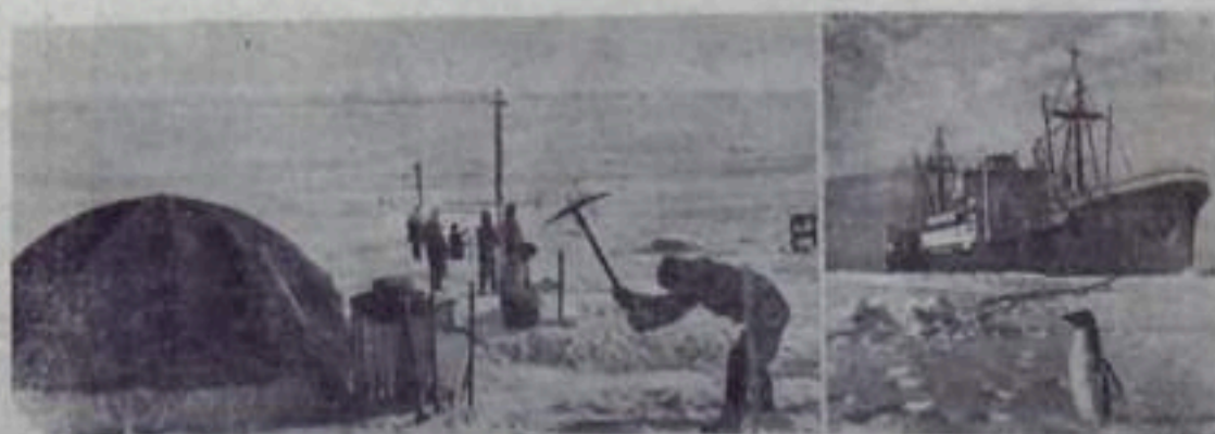
НА СНИМКЕ: слева — строительство поселка Мирный. Подготовка места для установки радиомачт. Справа — флагманский корабль экспедиции «Оба» у берегов Антарктиды.