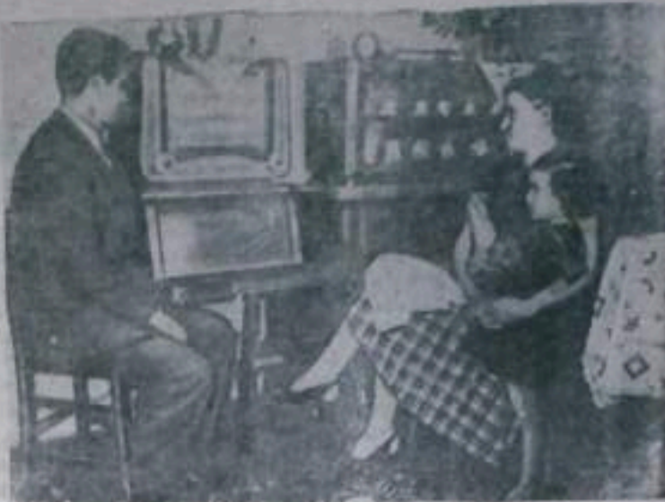
Многие трудящиеся Народной Республики Болгарии регулярно слушают передачи московского радио на болгарском языке.

Надо полагать, что партийная и профсоюзная организации стройки изменят пассивную позицию невмешательства на активную и привоют к порядку тех, кто зажимает критику, выступает против рабкора В. С. Рубана.