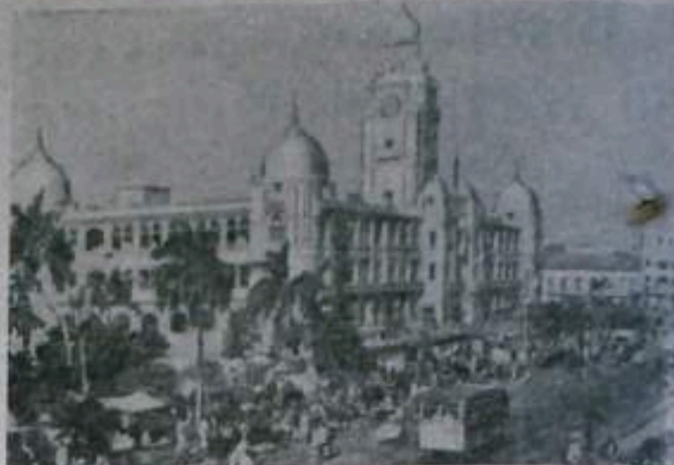
Пакистан. На одной из улиц города Карачи. Фотохроника ТАСС.