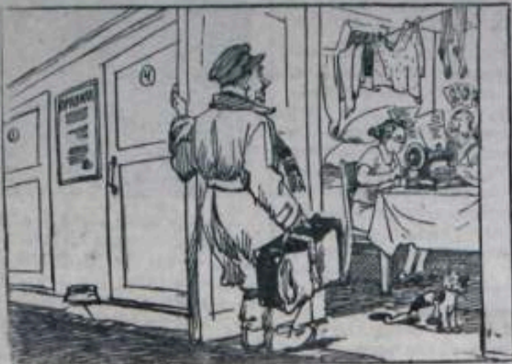
ПРИЕЗЖИИ—Вот так номер!

Гостиница жилищно-коммунального отдела треста «Башкируголь» ежегодно приносит многотысячные убытки, ибо многие номера в ней заняты постоянными жильцами, которые платят на льготных условиях, хотя и занимают лучшие комнаты.