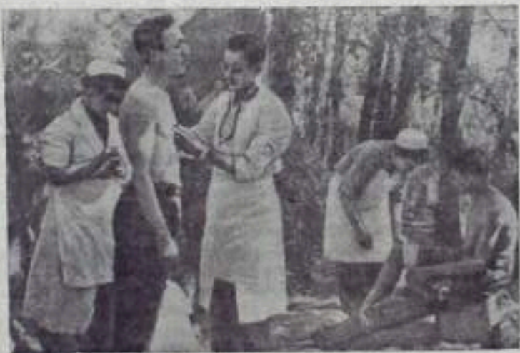
На снимке: в полевом госпитале национально-освободительной армии Алжира.