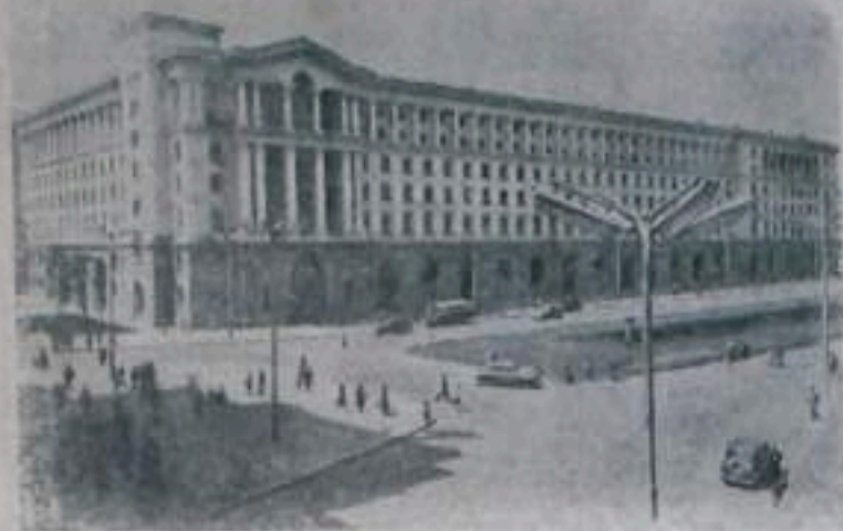
Народная Республика Болгария. Здание министерства электрификации в Софии.