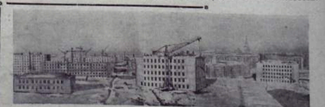
Москва. Коллектив строителей треста «Мосжилстрой» объявлен в 1958 году сдать в эксплуатацию 141.100 квадратных метров жилой площади. Несколько новых кварталов вырастут на Юго-Западе столицы. В Черемушках, на 1-й Хорошевской улице.

Вечер закончился большим тематическим концертом художественной самодеятельности клуба Кумертауского строительного управления.