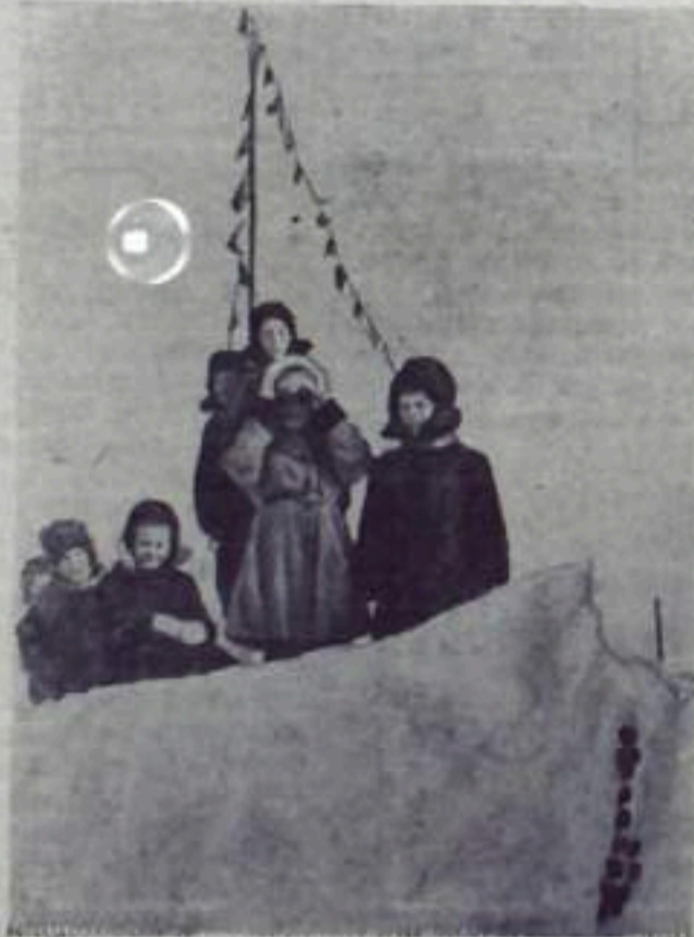
Сюрприз для малышей

Нам очень часто вовсе недомек, Что эта постоянная забота — Белье, Обед, Заштопанный чулок — Такая же серьезная работа. Твоей рукою созданный уют Нам очень много В жизни помогает... ...Недаром песни о тебе поют. Поэмы благодарные слагают. И потому — От чувства хороших что ль? — Хотят тебе мужнины удлибнуться. ...Хорошая, упорная, Позволь Твоей руки Признательно коснуться.