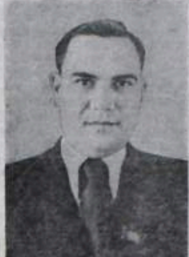
В. Г. Набиуллин — Председатель Совета Министров БАССР, кандидат в депутаты Совета Союза Верховного Совета СССР по Кумертаускому избирательному округу № 375.