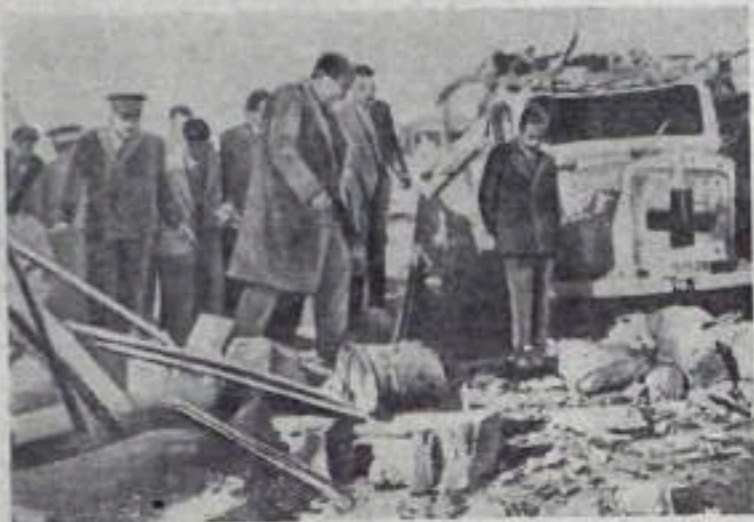
Тунис. Французские военные самолеты произвели бомбардировку селения Саквет-Сиди-Юсеф, расположенного поблизости от алжирской границы.