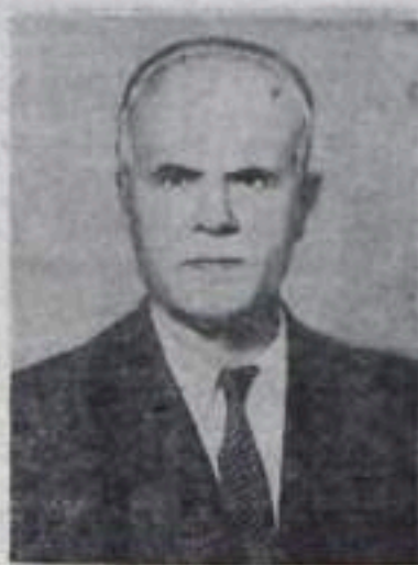
М. П. Тарасов — Председатель Президиума Верховного Совета РСФСР, кандидат в депутаты Совета Национальностей Верховного Совета СССР по Уфимскому избирательному округу № 19.