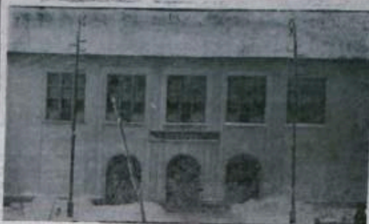
Залы столовой № 4 одно из лучших в нашем городе. На фото: залы столовой № 4.