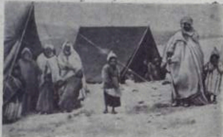
Тунис. В лагере алжирских беженцев в районе Тала-Насорни.