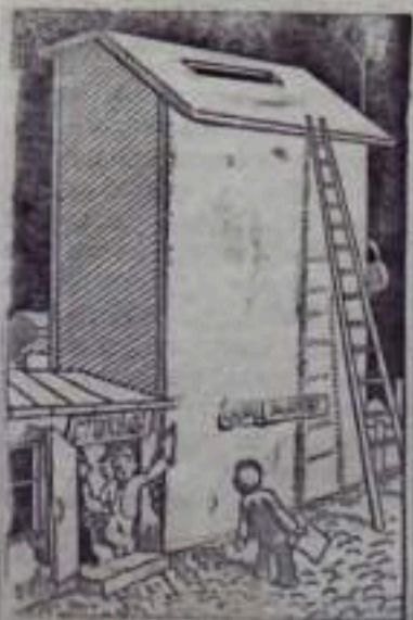
Маленькая столовая № 3, а жалоб на нее целый склад.

Самая обстановка столовой не располагает к аппетиту. Пища готовится безвкусная и чаще всего подается в холодном виде.