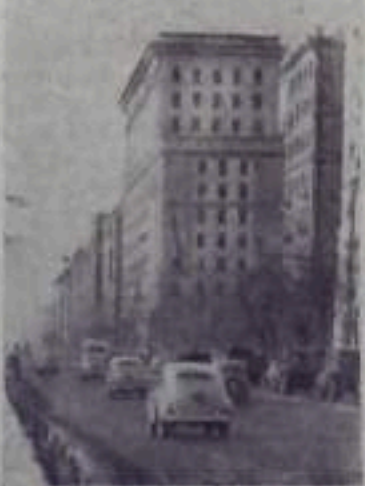
Москва сегодня. На Ленинградском проспекте.