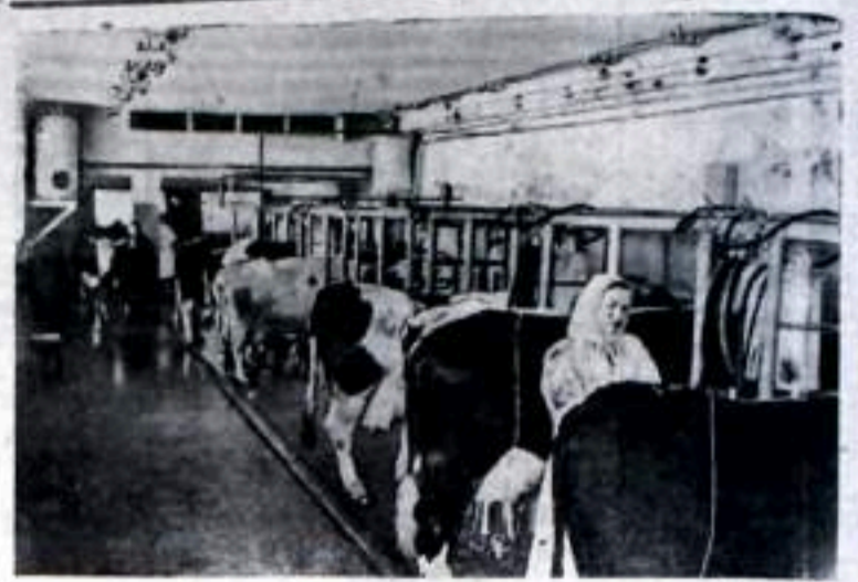
Московская область. В январе нынешнего года в совхозе «Люберецкие поля орошения» сдан в эксплуатацию специальный доильный зал, оборудованный двенадцатью доильными станками с молокоотборниками и молокопроводом.

(Из доклада Н. А. Булганина на XX съезде КПСС).