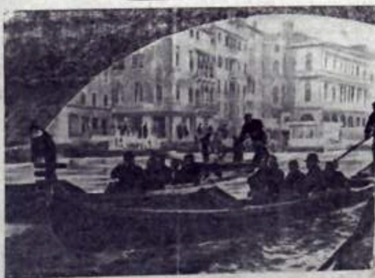
Италия. Советские туристы на прогулке по каналам Венеции.

Адрес редакции: г. Кумертау, улица Шахтостроительная, 12. Телефон редактора и общий редакции через городской коммутатор.