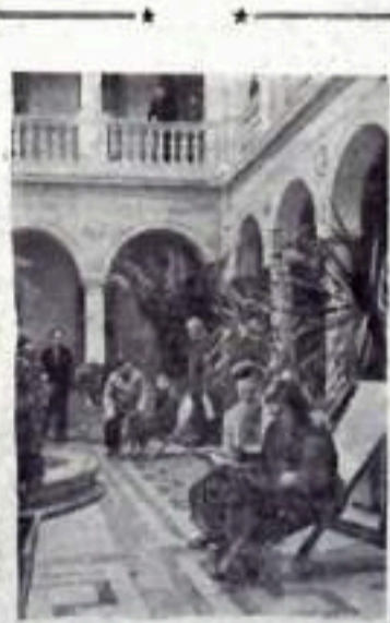
Крымская область. В Ялте недавно открылся новый санаторий «Большевик» Министерства здравоохранения СССР. Помимо спальных комнат, лечебных и других помещений, здесь оборудован крытый сад. В зимнее время — это одно из любимых мест отдыхающих. НА СНИМКЕ: уголок крытого сада.

Коллектив смены обязался работать лучше.