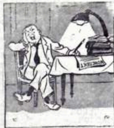
—Снова э-б-л, на чем в прошлом году остановился. Придется опять начать с первой главы.

заведующий партбиблиотекой горкома КПСС.