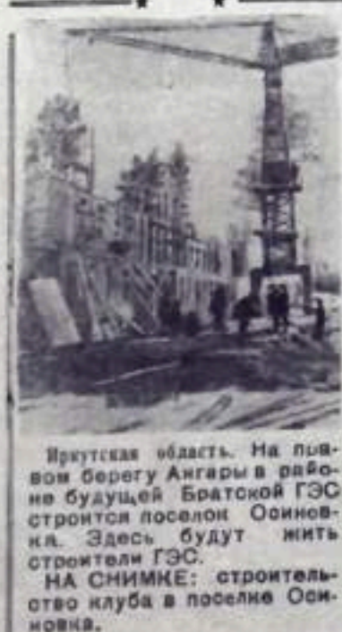
Иркутская область. На правом берегу Ангары в районе будущей Братской ГЭС строится поселок Осинновка. Здесь будут жить строители ГЭС. НА СНИМКЕ: строительство клуба в поселке Осинновка.

Лекцию прочитал член общества по распространению политических и научных знаний, кандидат исторических наук тов. Ильиченко.