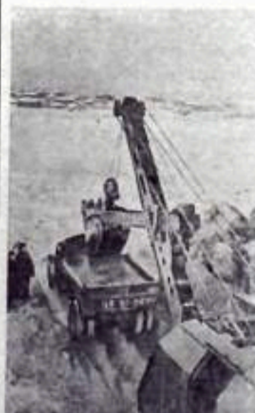
КРАСНОЯРСК. Началось строительство моста через реку Енисей. Он свяжет с городом промышленные районы, расположенные на правом берегу Пролетарского строения будут выполнены из сборного железобетона. НА СНИМКЕ: рывье котлована под опору моста через Енисей.

В порядке шефской помощи коллектив автобазы сейчас обязался отремонтировать колхозу автомашину, мотор от машины «ГАЗ-51», оборудовать вагончик. Связь коллектива автобазы с подшефным колхозом крепнет,