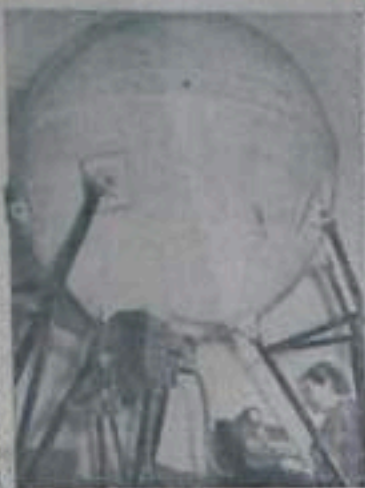
Изот четвертый месяц Международного геофизического года.

Непрерывные наблюдения в искусственно воссозданном лучей в различных точках земного шара с помощью стандартных регистрирующих аппаратов во время работ по программе МГТ имеют большое научное значение.