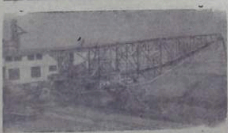
Транспортно-отвальный мост Байдаковского углеразреза.

С честью выполнили предпраздничное обязательство строители треста «Дмитроуглестрой». Они раньше срока выполнили 11-месячный план строительных работ и ввели в эксплуатацию с начала года свыше 20 тысяч квадратных метров жилой площади. К октябрьским праздникам коллектив строительного управления №4 заасфальтировал ряд улиц в Александрии и рабочих поселке Победа. Сотни трудящихся города справили новоселье в новых благоустроенных домах.