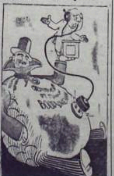
Чрезвычайное по вопросам разоружения.

Призывы руководителей США и Англии продолжать политику военных приготовлений вызвали резкую критику на Западе. Известный американский обозреватель Линпман, указывая на пагубность такого курса, подчеркивает, что США должны учитывать жизненные факты. А эти факты, отвечает Линпман, состоят в том, что Советский Союз теперь превосходит Соединенные Штаты Америки в ряде областей. К такому же выводу приходит и английская газета „Дейли геральд“, считающая, что для США и всего западного мира наступило время ужиться с миром социализма. В. Харников.