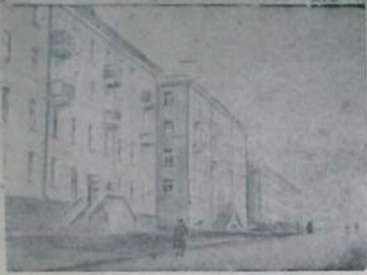
КУМЕРТАУ СТРОИТСЯ. С каждым годом меняется облик нашего города. Появляются новые жилые дома. В текущем году коллектив жилстроуправления построил для горняков четыре четырехэтажных благоустроенных жилых дома. НА СНИМКЕ: новые жилые дома на улице Сталина.