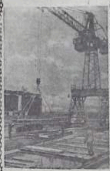
НА СНИМКЕ: выемка железобетонных изделий для жилищного строительства из вапорочных камер на открытом полигоне.

ЯРОСЛАВЛЬ. На окраине города сооружается крупный Ново-Ярославский нефтеперерабатывающий завод. Сейчас здесь разрабатывается строительный рабочий поселок, а также промышленная база. В ознаменовании 40-й годовщины Великого Октября строители обязались построить до конца года 17450 квадратных метров жилой площади, а также ряд культурно-бытовых сооружений. На стройке широко применяется железобетон.