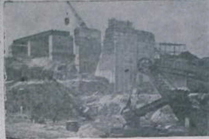
НА СТРОИТЕЛЬСТВЕ КРАСНОУДСКОЙ ГЭС. Коллектив строителей Красноярского гидроузла взял обязательство сдать в эксплуатацию гидроэлектростанцию на год ранее срока — в 1959 году. Гидростроители за 9 с половиной месяцев текущего года вывели на большой объем работ. Вырыт котлован для здания ГЭС и водосливной плотины, сооружена опалубка первой и второй секций будущего здания ГЭС. Бригады арматурщиков и бетонщиков возводят бычки. Монтажники укладывают металлические фермы бетонной астакады. НА СПИДМКК: расчистка основания котлована, где будет возведено здание ГЭС.

Ныне, продолжая ту же линию, Советское правительство внесло на рассмотрение XII сессии Генеральной Ассамблеи Объединенных Наций проект Декларации о мирном сосуществовании государств. В нем все государства признаются основными друг на друга на принципах, уже принятых Бандунгской конференцией 29 стран Азии и Африки. Это известные пять принципов международных отношений: взаимное уважение территориальной целостности и суверенитета друг друга, ненападение, невмешательство во внутренние дела друг друга по каким-либо мотивам экономического, политического или идеологического характера, равенство и