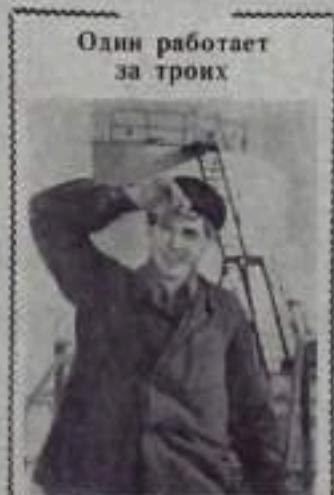
Один работает за троих

Успешно выполнена добыча угля. Более 100 человек, занятых в шахтах, газовой промышленности и в других отраслях народного хозяйства, награждены орденами и медалями. В связи с избранием члена Президиума ЦК КПСС и секретаря ЦК КПСС тов. Беляева Н. И. первым секретарем ЦК КП Казахстана, Пленум ЦК освободил тов. Беляева Н. И. от обязанностей секретаря ЦК КПСС.