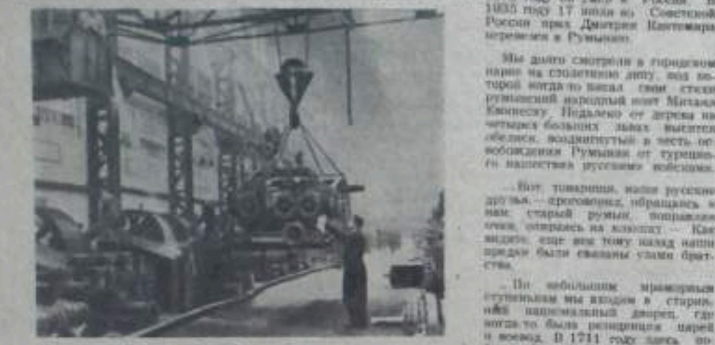
Румынская Народная Республика. Паростроительный завод имени 1-го Мая вступает в эксплуатацию. В настоящее время производится монтаж оборудования высокопроцентной буровой установки.