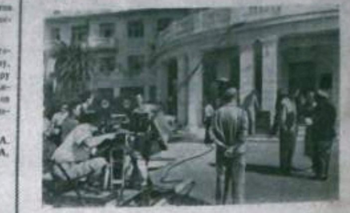
Краснодарский край. Московская киностудия снимает фильм «Наследство». На съёмке нового фильма.