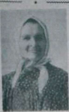
Виды двух лет работает...