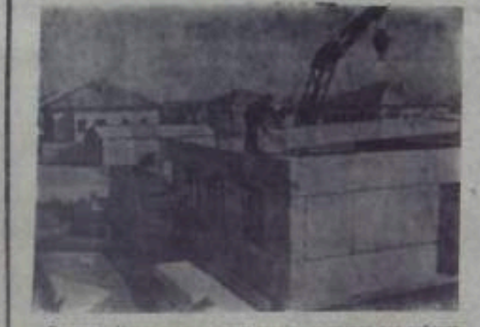
Варшава. Много работы в этом году приходится для рабочих...