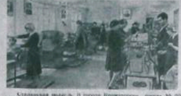
Станочная мастерская в школе № 22 поселка...