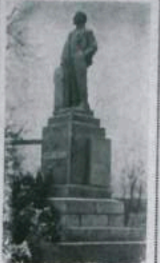
Тернопольская область. В селе Великие Боры установлен памятник В. И. Ленину...