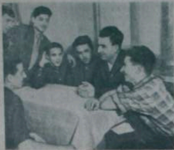
Взрослым комсомольцам... Комсомольцы первой пятилетки...