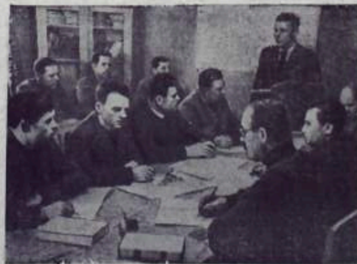
Винницкая область. Коммунисты колхоза имени Кирова Винницкого района изучают политическую экономию. Краткий курс истории партии. НА СНИМКЕ коммунисты колхоза за изучением материалов годового Пленума ЦК КПСС.