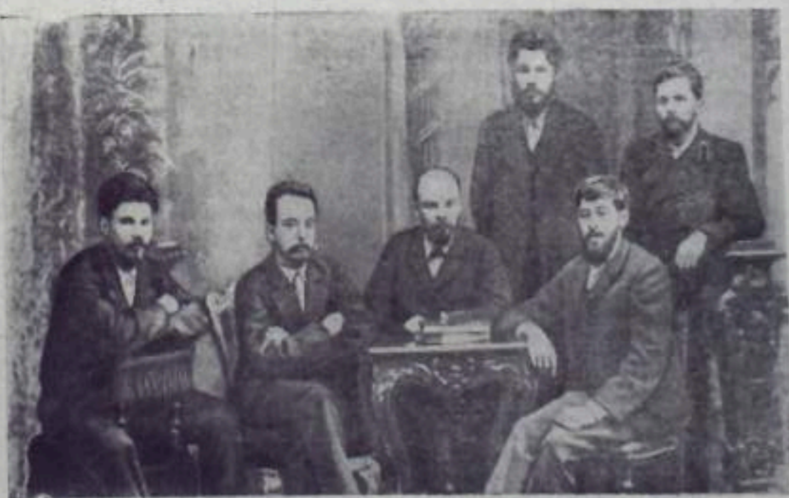
В. И. Ленин в группе членов Петербургского «Союза борьбы за освобождение рабочего класса», 1897 год. (Из материалов музея В. И. Ленина).