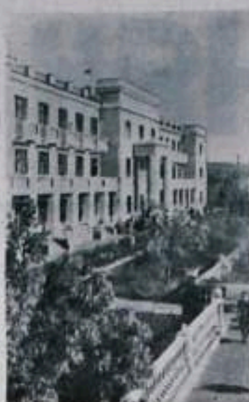
Украинская ССР. На берегу Азовского моря, в городе Жданове расположен санаторий металлургов Союза присаживают трудящиеся со всех концов страны. К их услугам — светлые, просторные комнаты, хорошо оборудованные лечебные кабинеты. В этом году в санатории проведи отлук три тысячи металлургов.