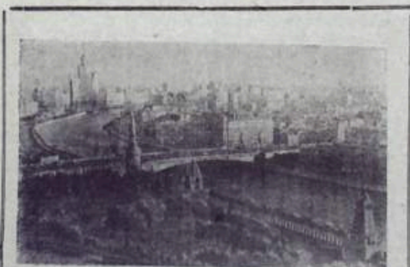
Москва. Вид на Москву-реку на Кремль с колокольни Ивана Великого.