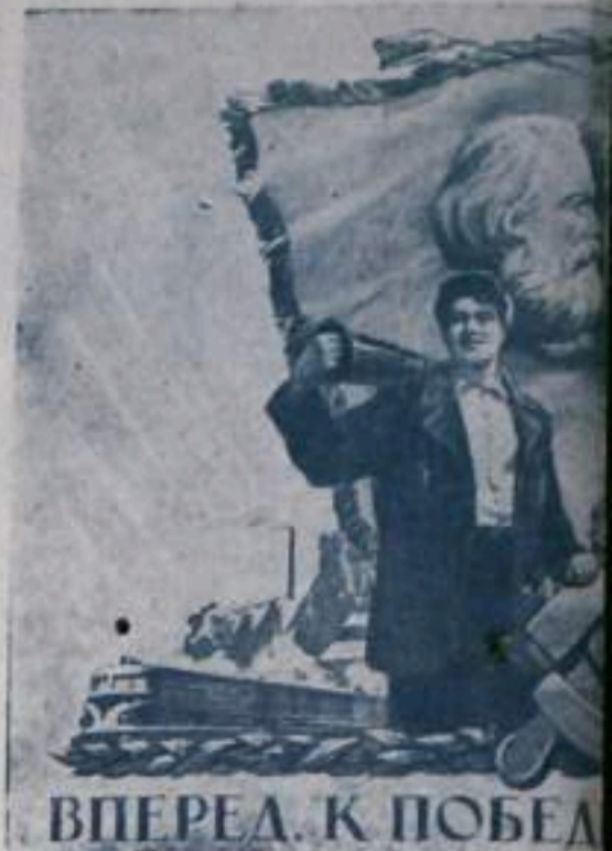
ВПЕРЕД К ПОБЕДАМ

начальник планового отдела Ермолаевского разреза треста «Башкируголь».