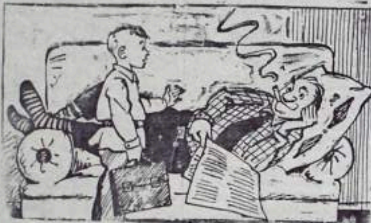
—Папа, учительница просила тебя прийти на родительское собрание. —Передай, что мне некогда, достаточно с меня своих со- общений и заседаний!