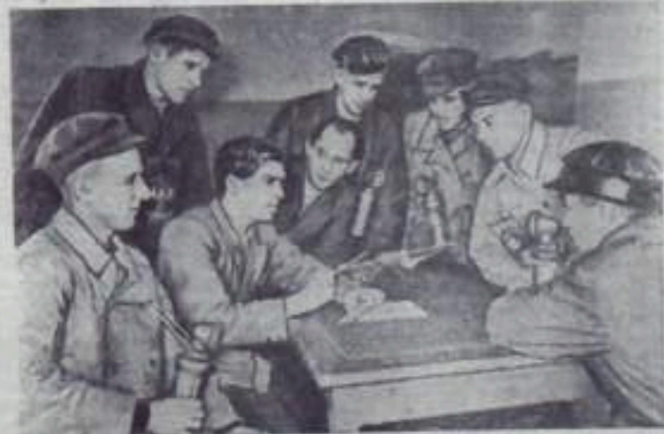
Ворошиловград. Коллектив шахты «Центральная-Белая» треста «Ленинголь» одним из первых в Ворошиловградской области перешел на новую систему оплаты труда—от платы добытого угля. Это мероприятие позволило горнякам преодолеть длительное отставание и выйти в число передовых. В сентябре коллектив предприятия добыл свыше 1,000 тонн топлива сверх плана. Если в августе ни один из эксплуатационных участков не выполнил установленного задания, то сейчас все они на два дня в день выдают топливо сверх плана. Отлично трудятся горняки 4-го участка. Работая по укрупненной тарифу, они добыли в сентябре около 500 тонн угля дополнительно к заданию. Среднемесячная добыча угля на участке выросла по сравнению с августом более чем в полтора раза. Соответственно повысились и заработки горняков. Машинист комбайна УКМГ-3 И. М. Нестерев за первую половину сентября выполнил задание на 160 процентов и заработал свыше 4 тысяч рублей—вдвое больше, чем за то же время в августе. В полтора—два раза выросли заработки и других горняков участка. НА СНИМКЕ: комбайновод бригады И. М. Нестерева (слева) вместе с помощником главного инженера шахты по нормированию П. В. Тысячкиным (третий слева) и помощником начальника участка Н. И. Придорожко (четвертый слева) подводят итоги работы участка.

качественных показателей угля. Трест выделил для Маячного разреза необходимое лабораторное оборудование. В адрес треста отгружено 4 установки для ускоренного определения влажности, одна из которых будет выделена Маячному разрезу, сделана заявка на молотковую дробилку для механизации разделения проб угля, так как шаровая мельница, о которой говорит автор статьи, для размалывания проб нашего бурого угля не пригодна. Руководству разреза дано указание об освещении мест породотборки и набора проб из железнодорожных вагонов.