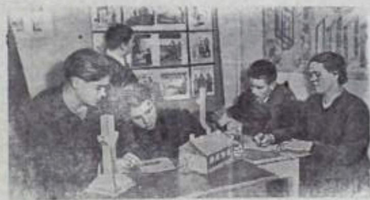
Комы АССР. На новостройках Севера трудится много молодых патриотов, прибывших сюда по призыву партии и правительства. В Печорском лесоконбинате, например, работают десятки юношей и девушек из Чувашской АССР и Ярославской области. Они успешно осваивают новые профессии строителей. НА СНИМКЕ: молодые строители в техническом кабинете конбината знакомятся с макетами новых домов, которые они должны возвести в ближайшее время.