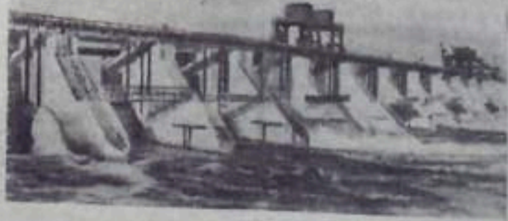
ГОРЬКОВСКАЯ ОБЛАСТЬ. Горьковская гидроэлектростанция вступила в строй. Первый агрегат уже выработал сотни тысяч киловатт-часов электроэнергии. НА СНИМКЕ: водосливная плотина Горьковской ГЭС.