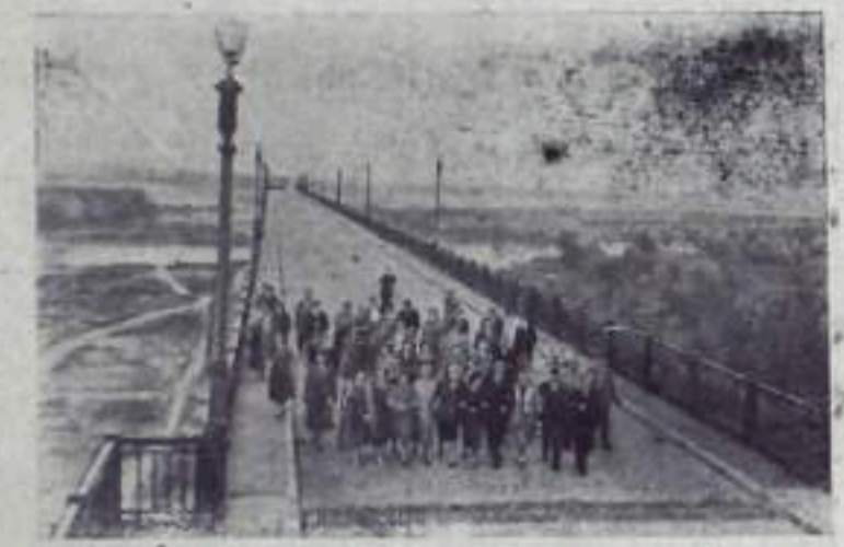
Во время пребывания в Румынской Народной Республике советские туристы посетили «Мост дружбы и мира», соединяющий Румынию с Болгарией. НА СНИМКЕ: туристы на мосту.

По случаю ввода в эксплуатацию этого предприятия состоялся митинг.