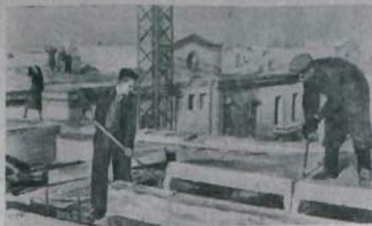
В Сталинграде по Комсомольской улице строится первый жилой дом с крышей из сборного железобетона. НА СНИМКЕ: укладка панелей новой крыши.