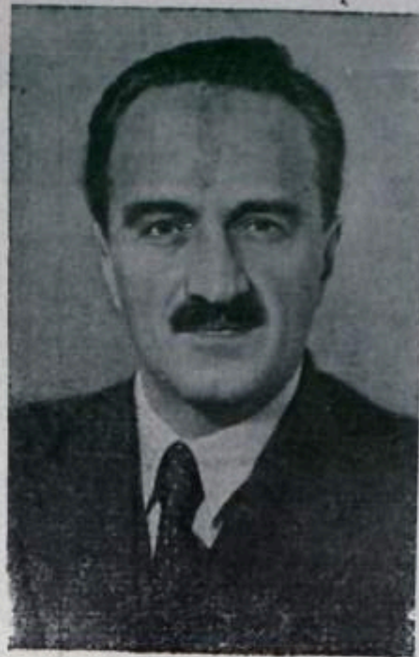
А. И. Микоян