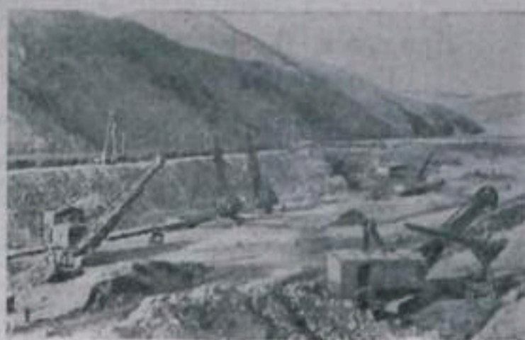
Восточно-Казахстанская область. Строители Бухарминской ГЭС продолжают выемку грунта со дна Иртыша, огороженного перемычкой. Подготавливается место для укладки бетона в тело водосливной плотины. НА СНИМКЕ: общий вид строительства Бухарминской ГЭС.

В выставке приняли участие средние школы №№1, 2, 3, 8, 10, семилетняя школа №4 и дом пионеров, который представил самое большое число разнообразных экспонатов.