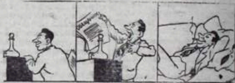
Пел соловьем на отчетном собрании, Клятвы давал, раздавал обещания. Минули выборы, и он Вновь погрузился в сладкий сон.

Некоторые председатели профкомов, отчитавшись на конференции, не спешат проводить в жизнь ее решения.