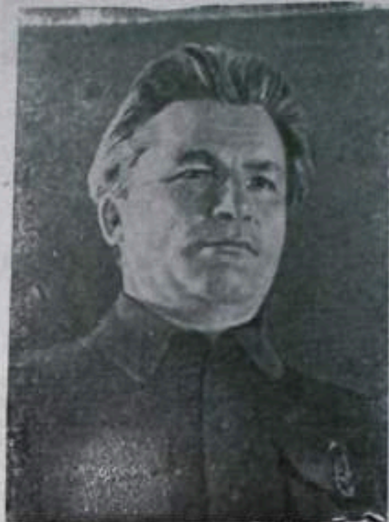
Сергей Миронович КИРОВ, видный деятель Коммунистической партии и Советского государства, первого декабря 1934 года был злодейски убит врагами народа.