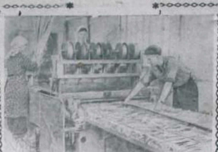
АСТРАХАНСКАЯ ОБЛАСТЬ. На Икрянинском камышитовом заводе успешно прошли испытания станка, предназначенного для производства 100 (миллиметровых) камышитовых плит. Производительность его 150—160 квадратных метров камышитовых плит в смену.

Сейчас рабочие натуреваются, как члены редколлегии будут реагировать на критику.