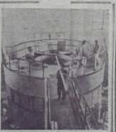
РУМЫНСКАЯ НАРОДНАЯ РЕСПУБЛИКА. Атомный реактор мощностью в 2000 квт/ватт, построенный румынскими специалистами с помощью Советского Союза.