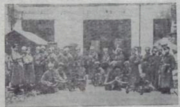
Октябрьские дни в 1917 году. Солдаты Кексгаальского полка, занявшие телефонную станцию в Петрограде.

Наш полк был переброшен на Северный фронт в Эстонию. Тяжелые муки и страдания еще больше усилили озлобление и ненависть солдат и всего народа к эксплуататорам. Неудержимо нарастала новая революционная ярость.