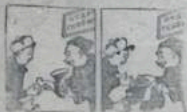
Топор и рукавицы...