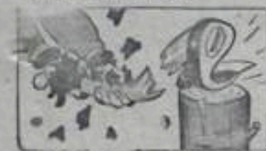
Рукавицы и топор!...