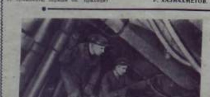
Туркская область. В Паликском угольном бассейне...

За сентябрь наша заводская бригада, борющаяся за выполнение коммунистической, не выполнила пятилетнего обязательства.