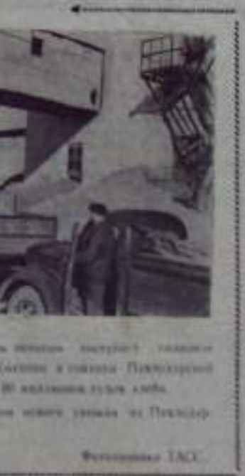
Канонерка ССР. Находясь в движении...