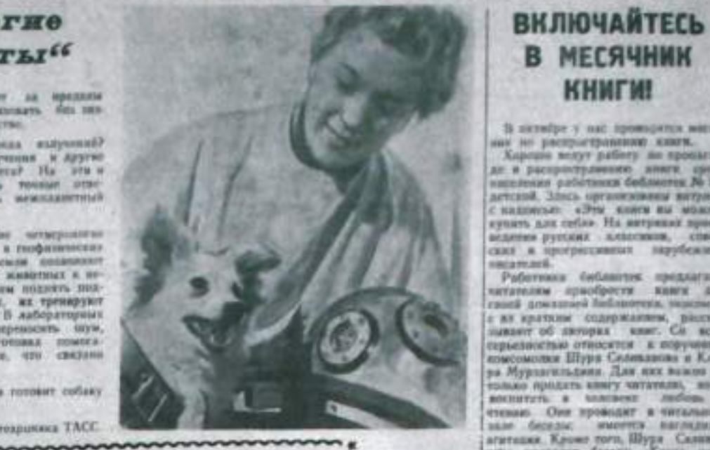
Четвероногие „космонавты“ — это собаки, которые обучаются полету в космосе.

Борьба за коммунистический рабочий класс — это главная задача партии. Партия должна быть готова к работе в условиях новой пятилетки. В 1965 году будет осуществлен первый пятилетний план пятилетнего плана. Партия должна быть готова к работе в условиях новой пятилетки. В 1970 году будет осуществлен второй пятилетний план пятилетнего плана. Партия должна быть готова к работе в условиях новой пятилетки.