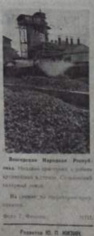
Воскресенье Нарманов Ринчуб...

Улан-Батор. 25 октября... Улан-Батор. 25 октября... Улан-Батор. 25 октября... Улан-Батор. 25 октября.