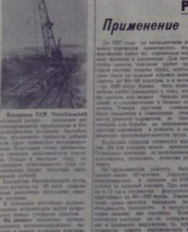
Крупнейшая в СССР Машиностроительная фабрика — производящая и обслуживающая технику в Кумартаульской дистанции пути № 26 Бурбайской железной дороги.