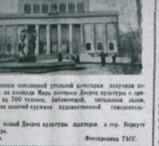
Верхура, Горюхи запоздней утлойн догетарки плуцкая корной подарок на площади Мира вострел Днпрел культуры с зрительной залом на 700 человек, библиотечной, читальным залом, приемными для гостей кружок художественной самодеятельности.

В институте с республикой XXI... проект закона о повышении роли общественности в борьбе с нарушителями советской законности и правил социалистического общежития. Проект закона предусматривает расширение роли общественности в борьбе с нарушителями советской законности и правил социалистического общежития.