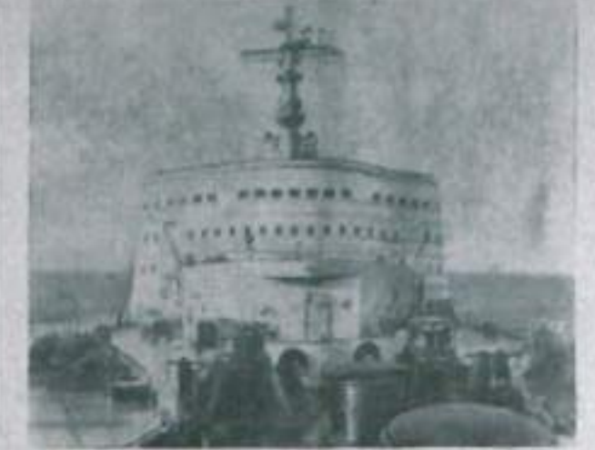
В Балтийском море успешно проходят ходные испытания...