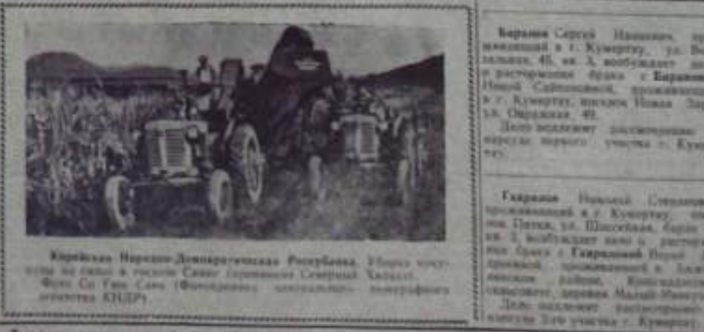
Кировская партия Ленинградского района.

В этой книге описаны различные новинки иностранной литературы. Это поможет вам лучше понять мир и себя. Мы приглашаем родителей и учителей принять участие в этом мероприятии.