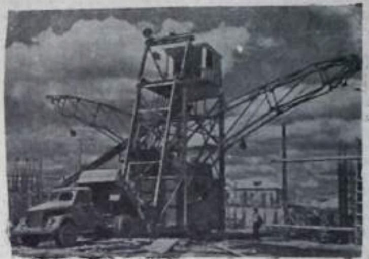
Гомельская область. В поселке Шатилян сооружается одна из крупнейших в республике Василевичевская ГРЭС. На всех участках стройки кипит напряженная работа. В этом году коллективу предстоит вынуть и переместить 400 тысяч кубометров грунта, уложить около 4 миллионов штук кирпичей, более 1.000 тонн арматуры, 14 тысяч кубометров бетона, ввести в строй 3 тысячи квадратных метров жилой площади. Задание успешно выполняется. На укладке бетона работает агрегат, сконструированный по предложению главного инженера стройуправления ГРЭС И. В. Копельяна. За час он укладывает до 20 кубометров бетона.