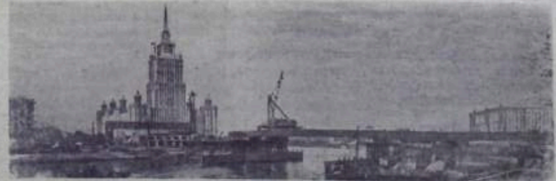
Москва сегодня. Вид через Москву-реку на строительство Ново-Арбатского моста и строящееся здание гостиницы „Украина“.