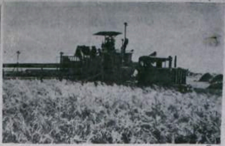
Госхоз „Дружба“ (провинция Хэйлуцзян) является самым механизированным хозяйством Китайской Народной Республики. Весной этого года на 16.000 гектарах была посеяна пшеница. С каждого гектара собрано от 16 до 25 центнеров зерна.