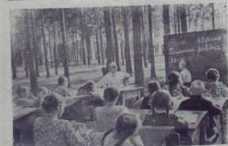
Руневская область. В живописном уголке соевого бора по Саранин расположенная летняя школа-интернат. Здесь живут и учатся 50 мальчиков и девочек — учащихся первых — четвертых классов. В летней школе имеется 20 спальных, 4 учебных комнаты, просторная столовая. Весь день дети находятся под наблюдением врачей, педагогов и воспитателей. В погожие дни занятия, игнаны и сон происходят на свежем воздухе.

ОРС ТРЕСТА «БАШКИРУГОЛЬ» продает картофель, овощи свежие и соленые в неограниченном количестве. По желанию покупателей ОРС предоставляет транспорт для доставки на дом. Овощи и картофель продаются в магазинах № 2, № 8, № 13, № 19, № 20, в поселке Пятки в магазине № 11, в Маячном поселке в № 21. ОРС