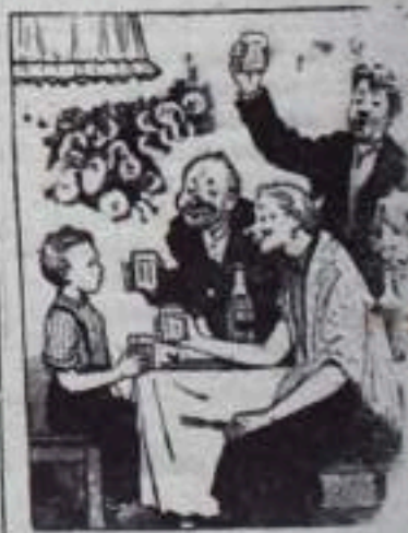
— За твое здоровье, сын.

Отдельные родители, вместо того, чтобы критически относиться к каждому случаю нарушения правил для школьника, сами способствуют этому. Отмечая дни рождения детей и в других торжественных случаях угощают даже малышей спиртными напитками.