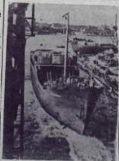
На днях в Дании спущена на воду рефрижератор «Красногорск», строящийся датской фирмой по заказу Советского Союза. НА СНИМКЕ: спуск судна на воду.