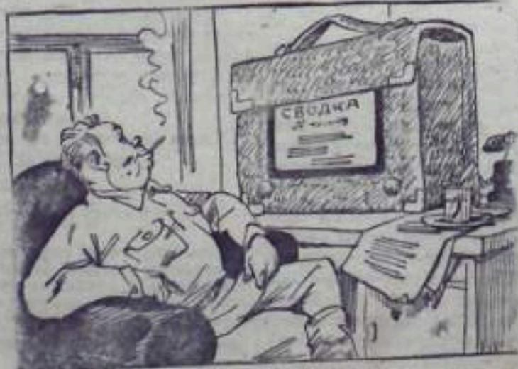
Гольштейн. Балласт мы исхаль зном, пути ремонтируем. Сведения в состоянии путевого хозяйства аккуратно писываем. Не войну только однок: почему каждый день аварии на путях?

Сведения посланы в трест, в Глазги. Но количество случаев схода паровозов и думпшаров с рельс не уменьшилось.