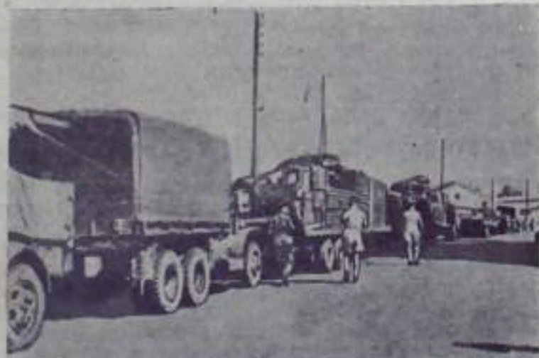
Англо-французские колонизаторы, продолжая политику нажима и военных угроз в отношении Египта, перебрасывают в районы Средиземного моря контингент войск.

НА СНИМКЕ: прибывшая на Кипр автоколонна французских войск направляется в район Фамагусты в сопровождении английской военной полиции.