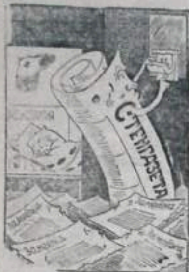
—Когда же праздник, когда выпустят?

В Ермаковском шахто-строительном управлении, Кумертауском строите-льно-монтажном управлении и ряде других стальные га-веты выпускаются редко, только к праздничным да-там и носят парадный ха-рактер.