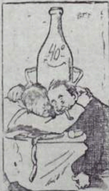
...Пришли к полному взаимопониманию...