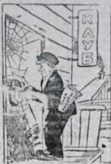
—Все меня ругают, что я клуб не отрываю. А как же я его открою, если замок заржавел?

Ветхий, неприглядный вид имеет клуб Кумертау-ского строительного управ-ления. Показывать кинокартин в нем уже дав-но запретили, а выступлен-ий участников художест-венной самодеятельности на сцене не было все лето.