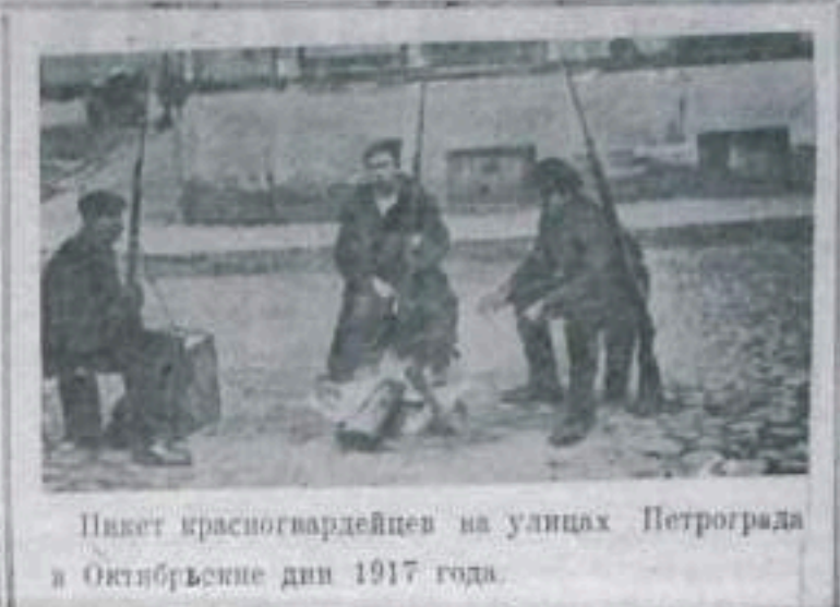
Пикет красногвардейцев на улицах Петрограда в Октябрьские дни 1917 года.