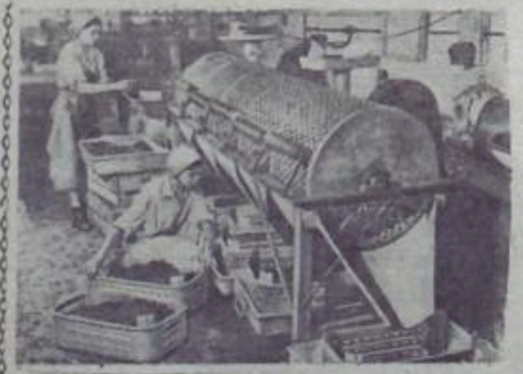
Венгерская Народная Республика. В цехе консервного завода в Дунакеси.

НА СНИМКЕ: Эва Сельтерен и Палло Комовы сортируют ягоды с помощью машин.