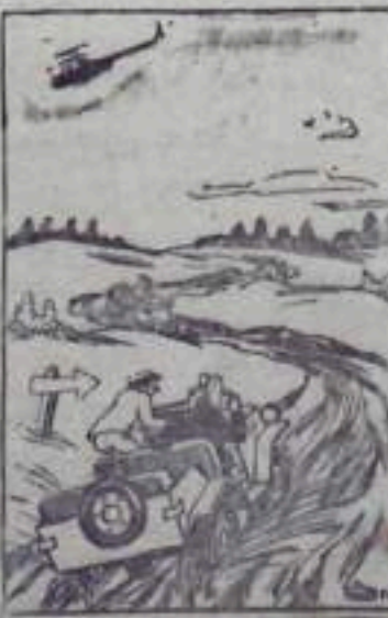
— Хорошо вертолету!

В нашем городе дороги в основном благоустроены, асфальтированы. Но отдельные автодороги, выходящие из города, требуют ремонта. Особенно плохая дорога около южных отвалов Курментауского угольного разреза, ведущая к Ермалаеву. Во время весенней распутицы и осенних дождей по этой дороге очень трудно проезжать на автомашинах.