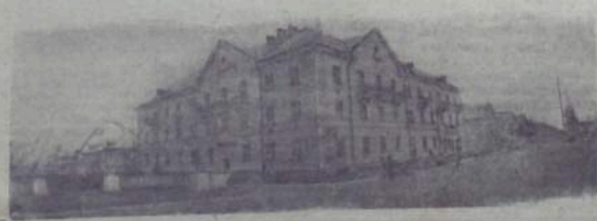
Кумертау. Жилой дом на углу улиц Ленина и Парковой