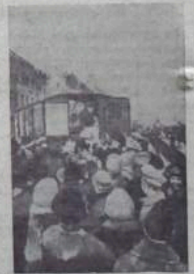
Раздача газет на Театральной площади в Москве в дни революции 1917 года.

управляющий Буертауским отделением Госбанка.