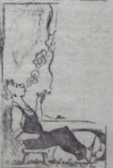
«ГОРНЯК» 3 стр. 20 сентября 1957 года.