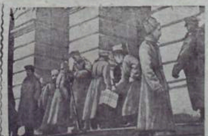
НА СНИМКЕ: у входа в Смольный, 1917 год.