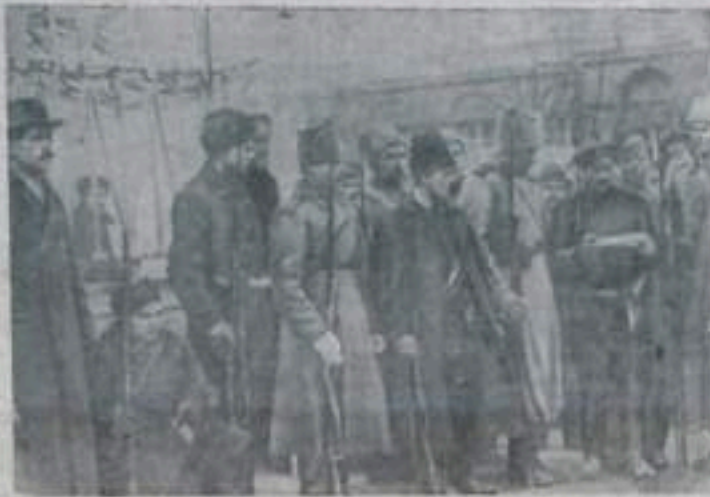
Пикет Красной гвардии проверлет пропуска у входа в Смольный. Октябрь 1917 г.

25 октября (7 ноября) 1917 года свершилась Великая Октябрьская социалистическая революция. Буржуазное Временное правительство было свергнуто. Вся власть перешла в руки Советов. Советское правительство