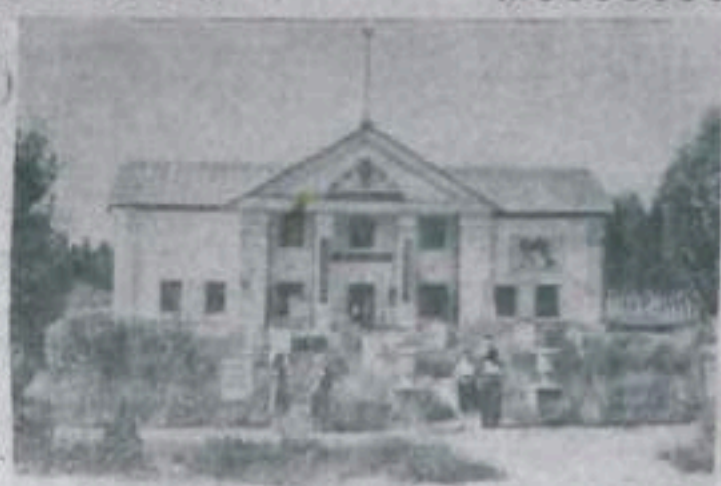
ЮЖНО-КАЗАХСТАНСКАЯ ОБЛАСТЬ; Кolkхоз «III Интернационал» Ильяшевского района — одно из передовых хозяйств Южного Казахстана по урожайности хлопка. Хозяйство имеет свой Дворец культуры, где работают библиотека и читальный зал, демонстрируются кинофильмы, работают кружки художественной самодеятельности.