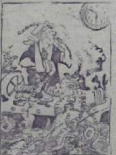
Что делать? Нет смены, а еще не начал уборку!

Захламленность на рабочем месте не только снижает производительность труда, угрожает рабочему, но и ведет к травматизму. Пока мы еще не можем сказать того, что у нас в цехе везде чистота и порядок. Отдельные сушильщики не производят уборку на рабочем месте и течение смены. Вот и получается такая картина: