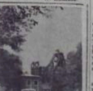
Земельная область. На поле «Земельная» работники сельского хозяйства работают до позднего вечера.

Ваша и девушка! Комсомола! Сегодня мы обращаемся к вам! Вот почему Лениному Коммунистическому Союзу Молодежи вчера исполнился один лет. 29 октября 1938 года образовался в Москве первый Всероссийский союз комсомольцев и комсомолок. Эта дата является для нас, как и для каждого из нас, днем рождения. В этот день мы должны помнить о том, как приумножили славные традиции комсомола.