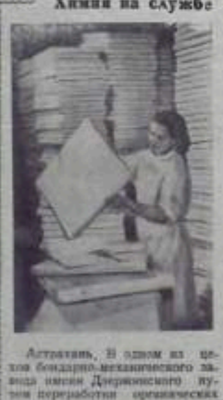
Хлеба на службе пародного хозяйства

Сила получают новый материал — получают, обрабатывают, вытирают, вытирают, вытирают. Из него изготавливают спандекст, спандекст, спандекст. Из него изготавливают спандекст, спандекст, спандекст.