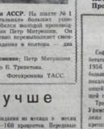
Коммунист. На шкоте № 1 «Колхозники» большой успех добился молодой агроном Степан Петрович. Он ежедневно перевыполняет задание в колхозе — два раза.