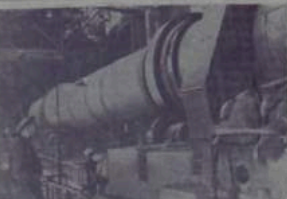
В настоящее время завод имени Коммунистического переименован в завод имени Коммунистического.

В настоящее время завод имени Коммунистического переименован в завод имени Коммунистического. В настоящее время завод имени Коммунистического переименован в завод имени Коммунистического.