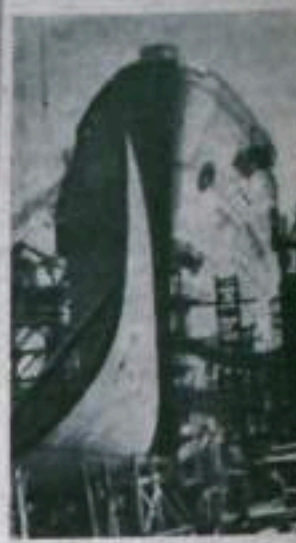
Украинская ССР. Пятигорский областной комсомольский коллектив бригады электромонтажников филиала Пятигорского филиала «Советский Ударник» сооружают коллективный завод имени Н.С.Хрущева. ЦК КПСС Украины направил эту бригаду в Пятигорский областной комсомольский коллектив бригады электромонтажников ударной комсомольской стройки. На снимке: штаб «Советский Ударник» на строительстве завода имени Н.С.Хрущева.