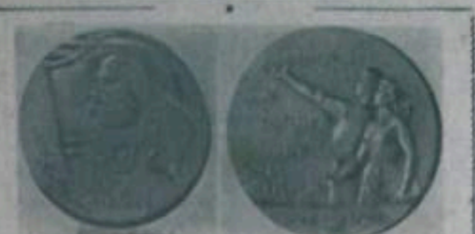
Ленинград. Монетный двор приступил к выпуску пробной памятной медали в честь 40-летия ВЛКСМ. Автор ее — московский скульптор В. М. Алмазунива. На снимках (слева направо) 1. Лицевая сторона медали. 2. Обратная сторона медали.

Советские государство призывает постоянную и постоянную заботу о детях, об их развитии и воспитании. Одной из особенностей этой заботы является расширение сети детских учреждений, школ, садов, пионерских. В нашем городе только за последние годы открыты несколько новых детских и школ, а сейчас их планируется создать десятки. Детские учреждения растут с каждым годом.