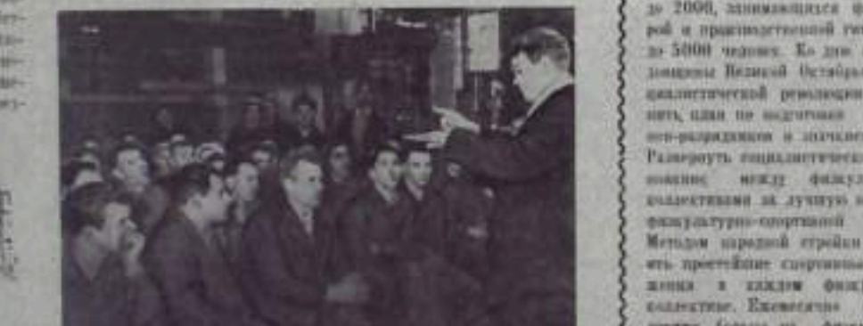
Ученые на заводе

В настоящее время завод имени Коммунистического переименован в завод имени Коммунистического. В настоящее время завод имени Коммунистического переименован в завод имени Коммунистического.