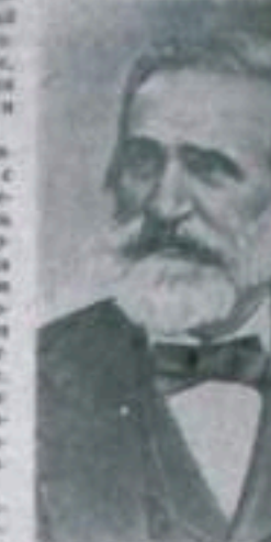
Джузеппе Верди (1813—1901) — великий итальянский композитор.