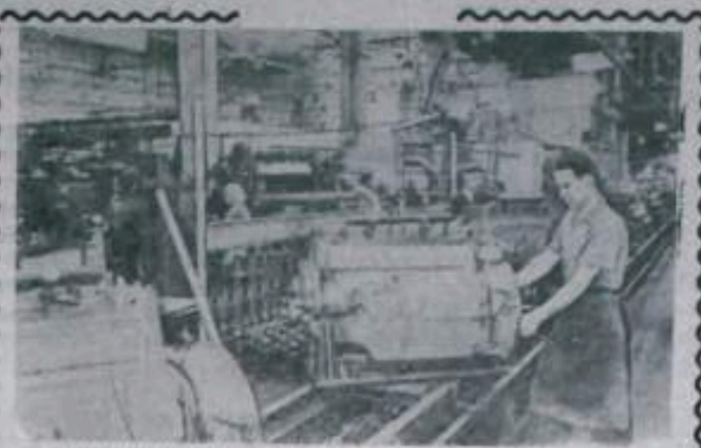
ЧЕЛЯБИНСКАЯ ОБЛАСТЬ. Уральский автомобильный завод имени Сталина в г. Миассе по итогам социалистического соревнования за 2-й квартал занял первое место среди предприятий Министерства автомобильной промышленности. Коллектив завода выкупили сверх плана 85 автомашин, 281 двигатель и большое количество запасных частей.