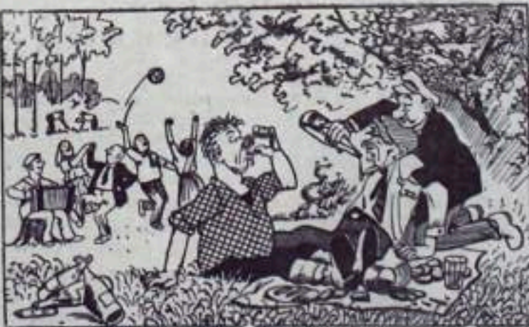
Погулять повеселиться — В их понятии — напиться