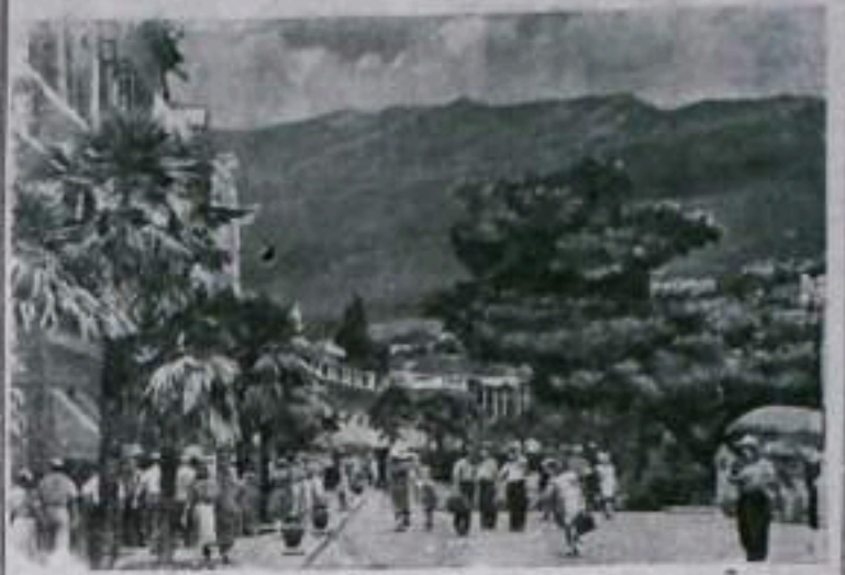
Южный берег Крыма. Набережная имени Ленина в Ялте.