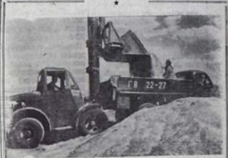
Сталинградская область. В этом году совхоз «Орошаемый» вырастил богатый урожай зерновых. НА СНИМКЕ: погрузка зерна на совхозном току для отправки на элеватор.

Г. БУДНИКОВ, машинист паровоза грузочно-транспортного управления.