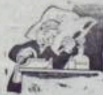
Что ты спишь, мужичок, ведь уж осень на дворе...

Ничего не делается на участке по улучшению работы связи. На весь участок имеется один телефон. На всех экскаваторах установлены радиостанции малой мощности, но ни одна из них не работает и машинисты экскаваторов не имеют никакой связи с диспетчером, работают вслепую.