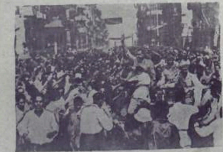
Народные торжества в Египте по случаю завершения эвакуации английских вооруженных сил из зоны Суэцкого канала.

НА СНИМКЕ: на улицах Порт-Саида. Демонстранты приветствуют президента Республики Египет Гамаль Абдель Насера.