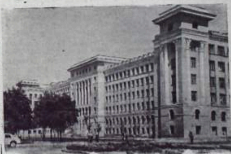
Харьков. Новое здание Харьковского медицинского института.