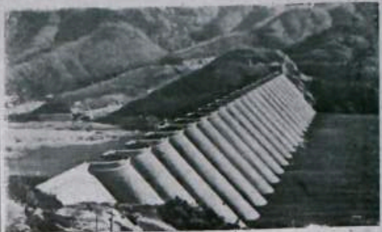
Китайская Народная Республика. Фодздинское водохранилище на реке Бихэ (провинция Аньхуэй). Его емкость — 470 миллионов кубических метров воды.