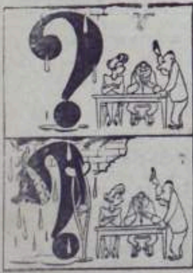
...он становится больным.