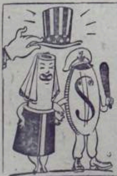
Брак по расчету Рис. Ю. Федорова.

20 сентября — концерт художественной самодеятельности Дворца угольщиков. Начало в 8 ч. 30 м.