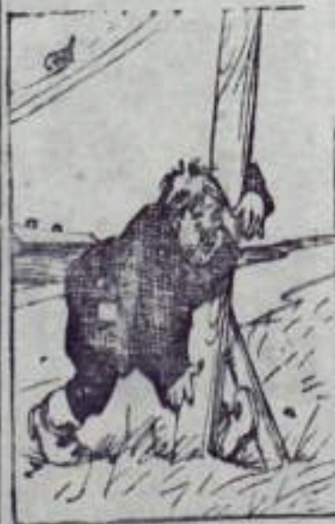
— До работы погн не доходят...

Коллектив драматического кружка художественной самодеятельности клуба имени Худайбердина на днях поставил комедийный спектакль по пьесе Валентина Катаева «День отдыха». Комедию с большим удовлетворением посмотрели около 600 трудящихся города.