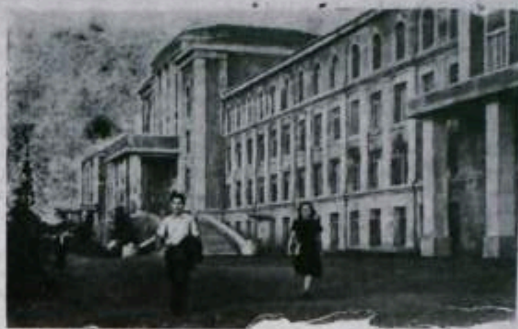
Корейская Народно-Демократическая Республика. Университет имени Ким Ир Сена в Хэньяне.