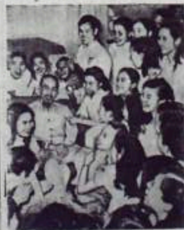
Демократическая Республика Вьетнам. Президент Республики Хо Ши Мин среди школьников.

Не воспитывают, видимо, таких чувств у молодых рабочих воспитатели и руководители интерната. Нельзя поверить тому, что руководство интерната не видит свалившейся изгороди. Так почему же до сих пор не организовали ремонт ее?