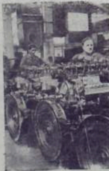
НА СНИМКЕ: в цехе сборки моторов.