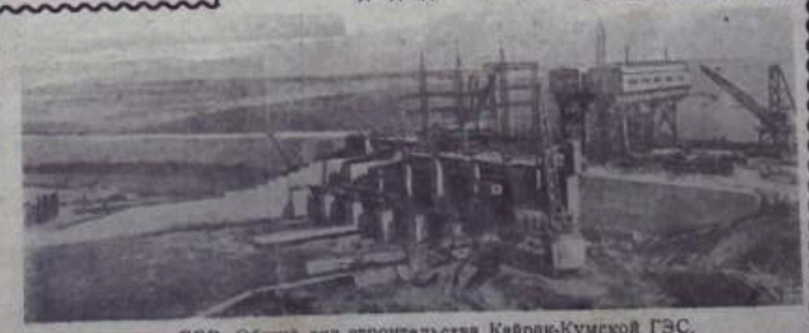
Таджикская ССР. Общий вид строительства Кайрак-Кумской ГЭС.