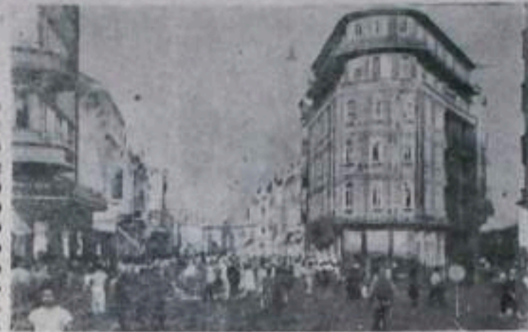
НАРОДНАЯ РЕСПУБЛИКА БОЛГАРИЯ. Город Сталин. Справа — Отець «Балкан турист» на улице 9 сентября.