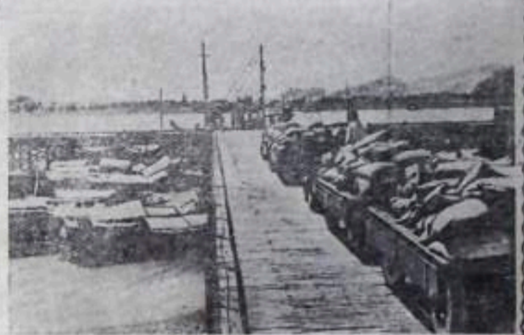
ДЕМОКРАТИЧЕСКАЯ РЕСПУБЛИКА ВЬЕТНАМ. В провинции Ха Тхун (центральный Вьетнам) закончено строительство крупной механизированной пристани Бан Тхон. НА СНИМКЕ: на новой пристани. Фото Вьетнамского информационного агентства.

До национализации 80 процентов промышленности Болгарии составляли мелкие заводы и мастерские с устаревшей техникой. Преимущественно это были текстильные, пищевые и деревообрабатывающие предприятия. Из отсталой сельскохозяйственной страны Болгария при народной власти превратилась в индустриально-аграрную. Создан ряд новых отраслей промышленности: нефтяная, черная и цветная металлургия, химическая, целлюлозная и др. По сравнению с 1948 годом производство электроэнергии увеличилось в четыре раза. (ТАСС)