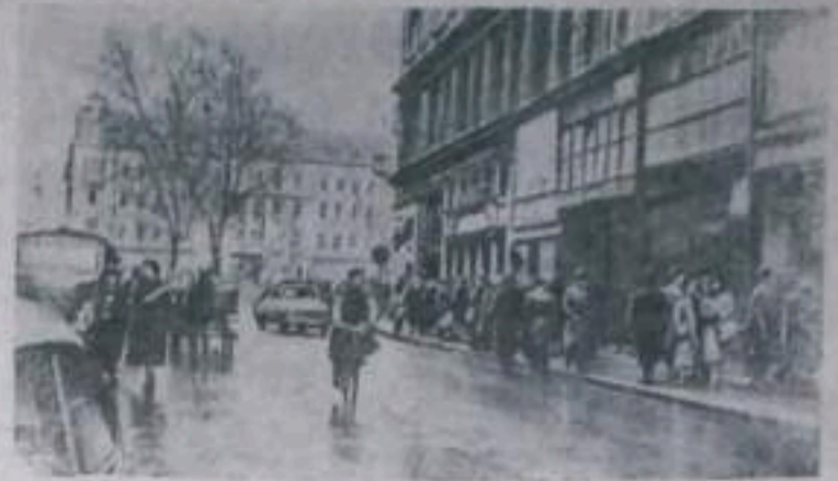
Стороживший победу над контрреволюционными силами венгерский народ возвращается к мирному созидательному труду.